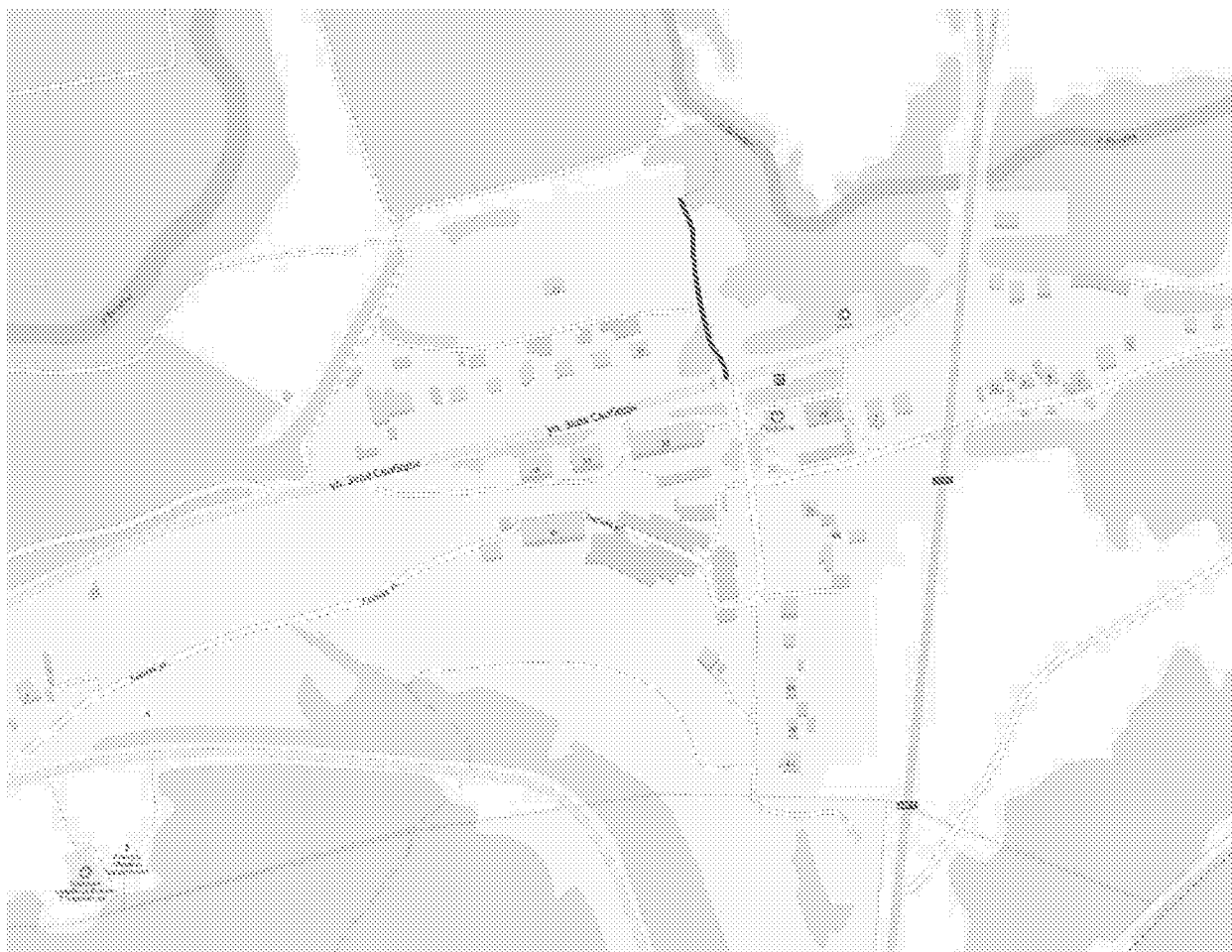
СХЕМА РАСПОЛОЖЕНИЯ переулка Сиреневого (село Поворотное) (от точки с координатами 44.566690, 33.430721 до точки с координатами 44.580326, 33.418953)

Приложение № 4 к постановлению Правительства Севастополя от 29.10.2020 № 550-ПП