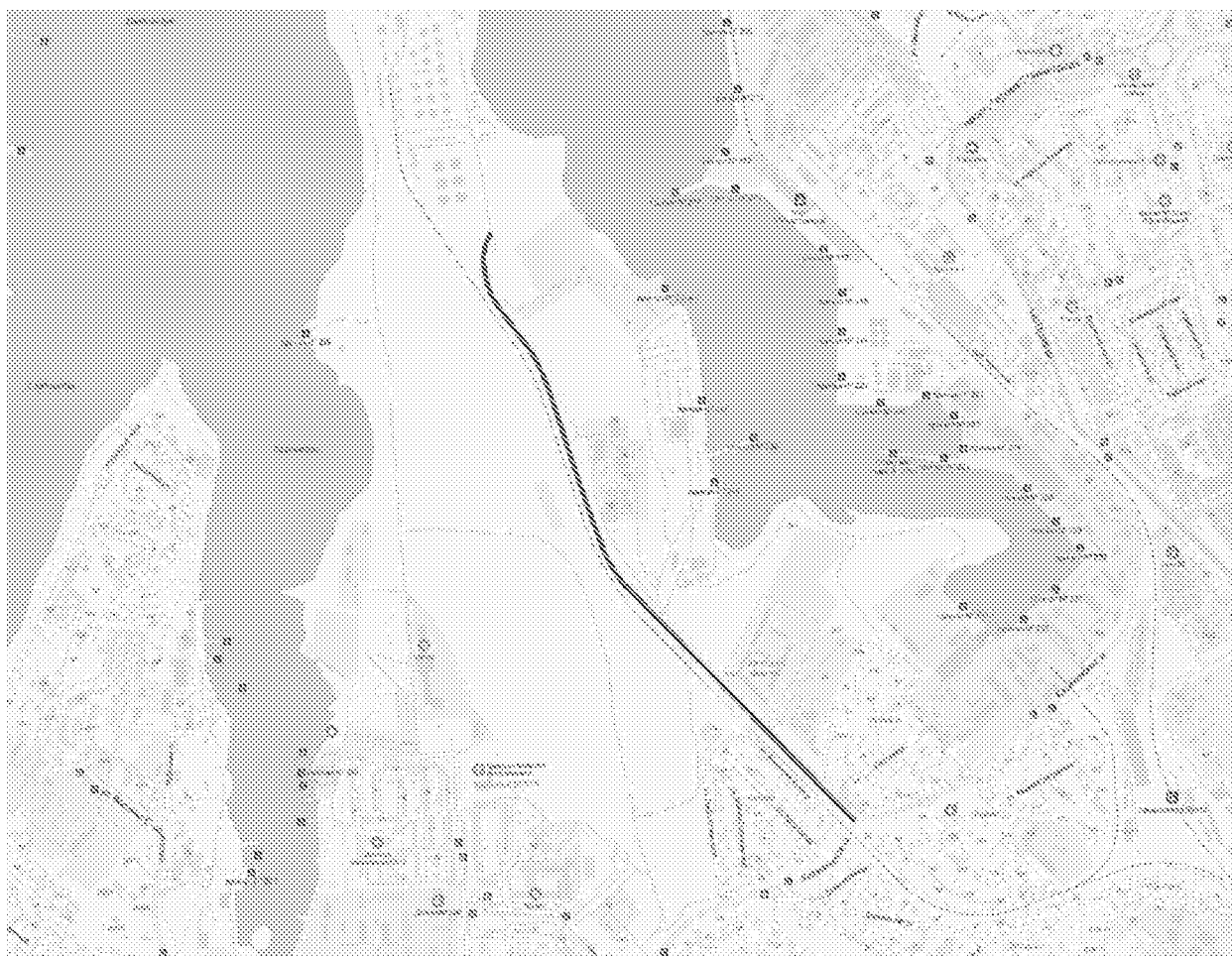
СХЕМА РАСПОЛОЖЕНИЯ улицы Братьев Манганари (от точки с координатами 44.566690, 33.430721 до точки с координатами 44.580326, 33.418953)

Приложение № 1 к постановлению Правительства Севастополя от 29.10.2020 № 550-ПП