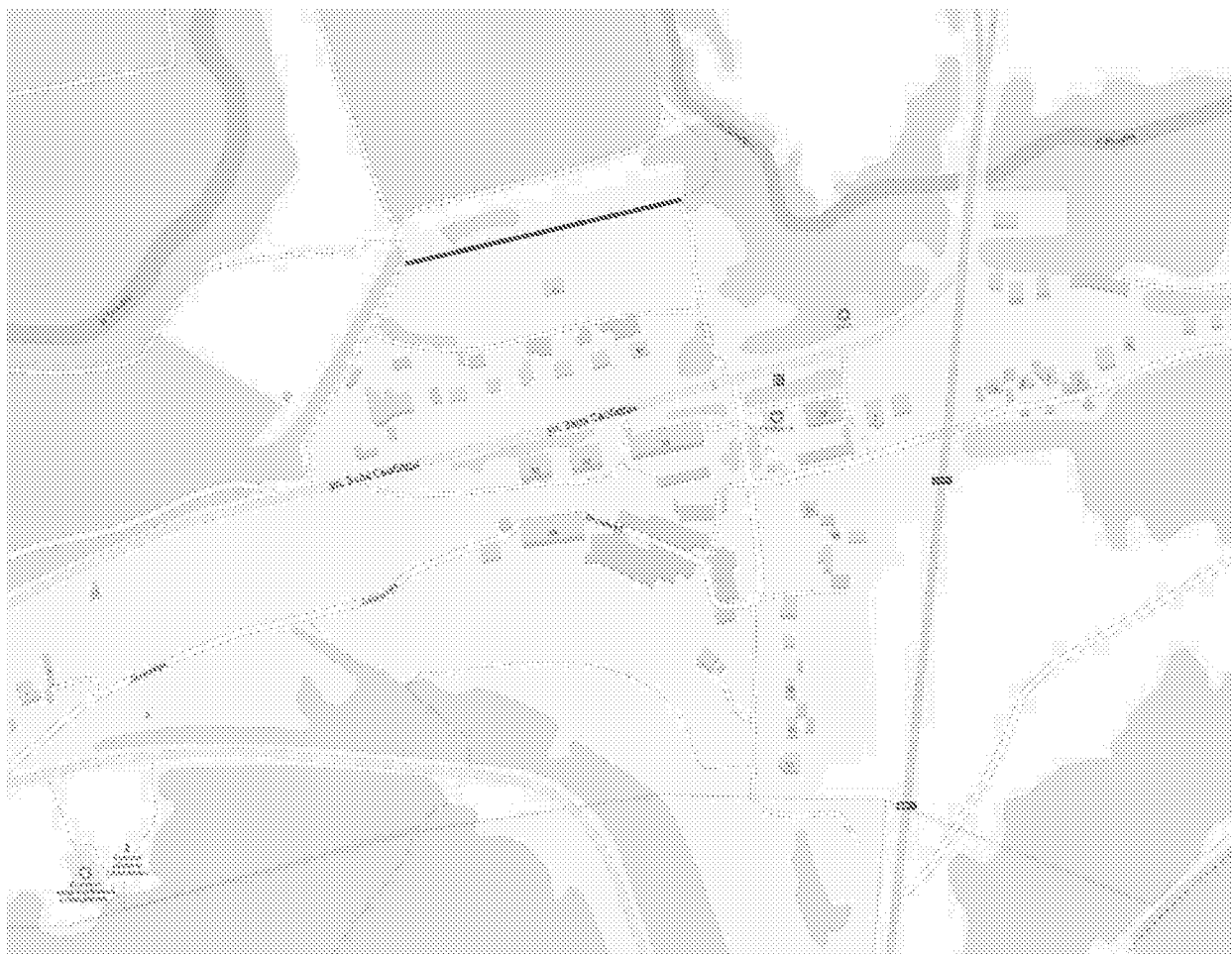
СХЕМА РАСПОЛОЖЕНИЯ проезда Цветочного (село Поворотное) (от точки с координатами 44.566690, 33.430721 до точки с координатами 44.580326, 33.418953)

Приложение № 5 к постановлению Правительства Севастополя от 29.10.2020 № 550-ПП