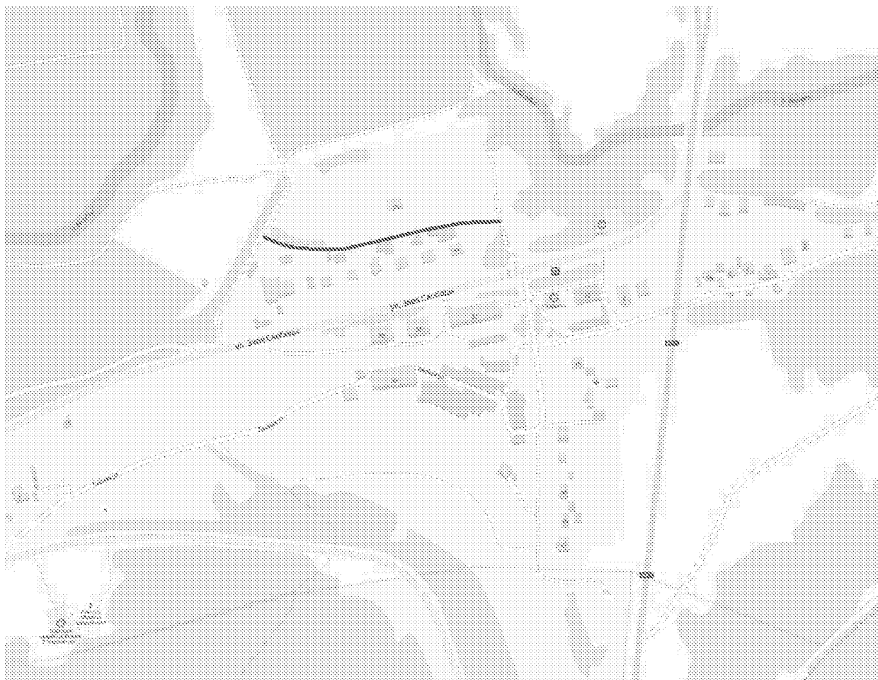
СХЕМА РАСПОЛОЖЕНИЯ улицы Ивана Дубинина (село Поворотное) (от точки с координатами 44.566690, 33.430721 до точки с координатами 44.580326, 33.418953)

Приложение № 3 к постановлению Правительства Севастополя от 29.10.2020 № 550-ПП