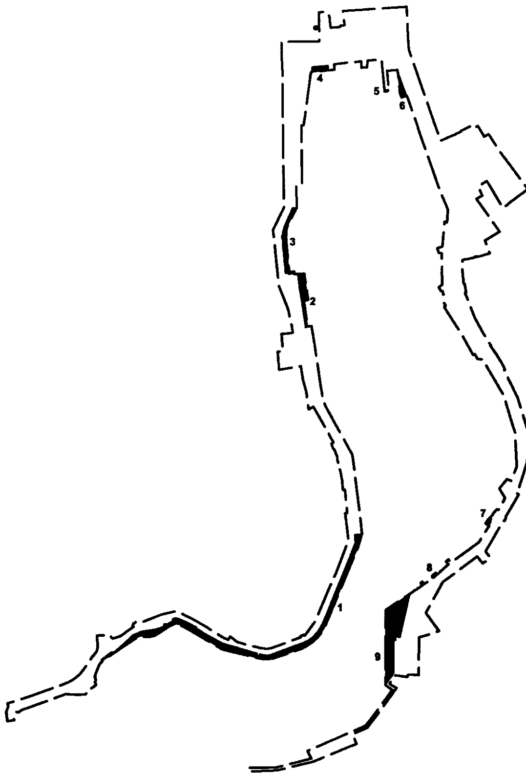
Рисунок 12 – Экспликация территорий, покрытых поверхностными водными объектами