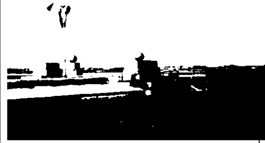
Фото 1963 г.

характерные точки визуального восприятия территории (с воды, дорожка от пристани, вид на поляну с памятником).