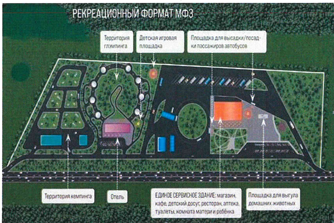
Схема МФЗ рекреационного формата

Таким образом, МФЗ могут стать площадками для развития локального бизнеса местных сообществ, стимулировать создание новых предприятий и