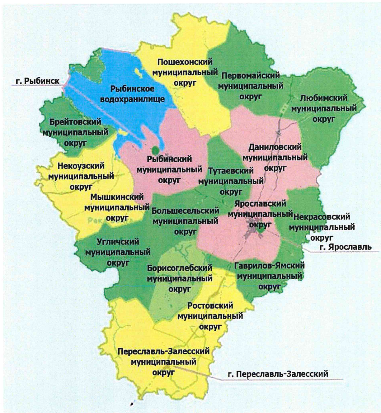
Карта обеспеченности населения муниципальных округов Ярославской области врачами