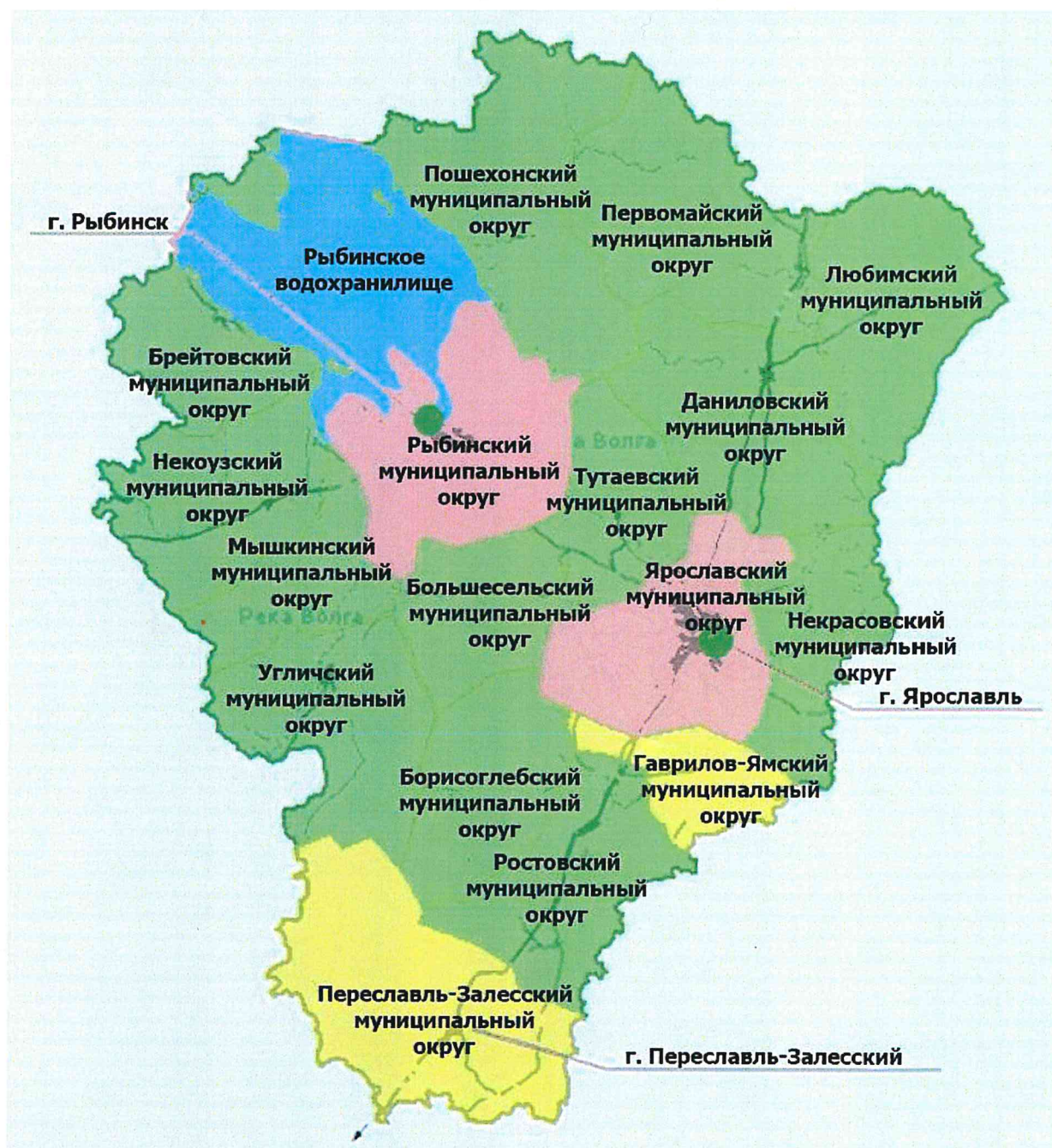
Карта обеспеченности населения муниципальных округов Ярославской области СМП