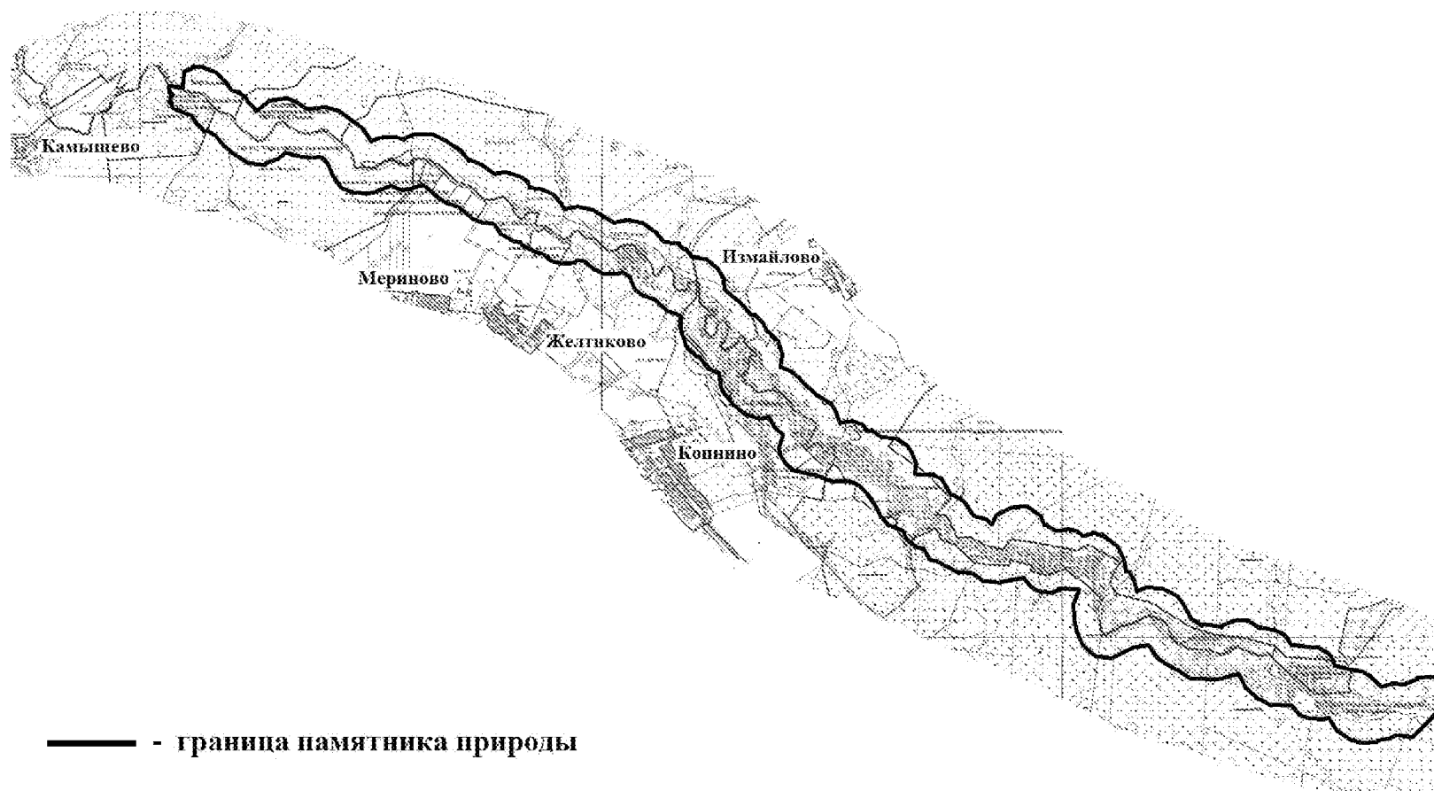
СХЕМА границ памятника природы «Долина р. Нерли Волжской»