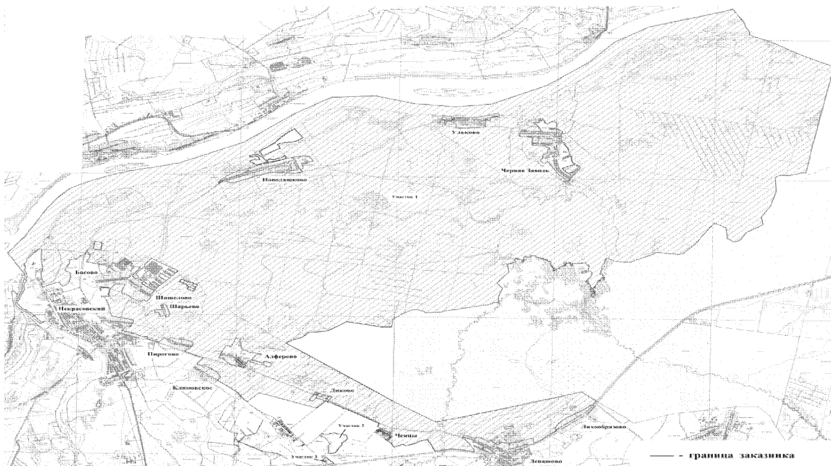
СХЕМА границ государственного природного заказника «Левашовский»