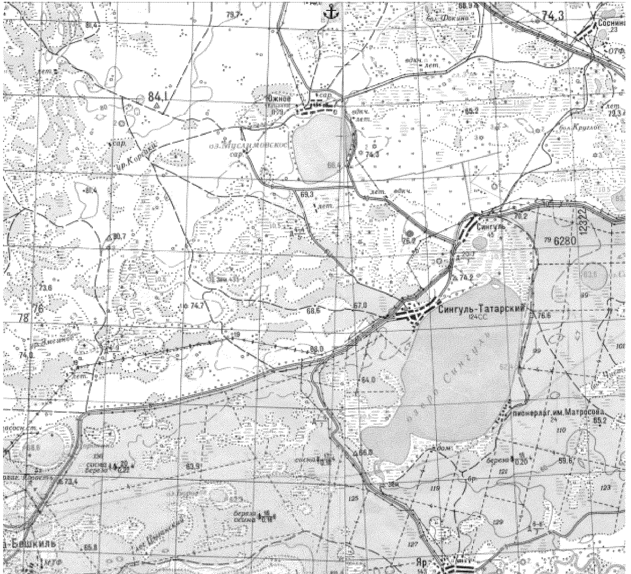
ОБЗОРНАЯ КАРТА ПАМЯТНИКА ПРИРОДЫ РЕГИОНАЛЬНОГО ЗНАЧЕНИЯ «СИНГУЛЬСКИЙ КУРГАН» МАСШТАБ 1:100 000