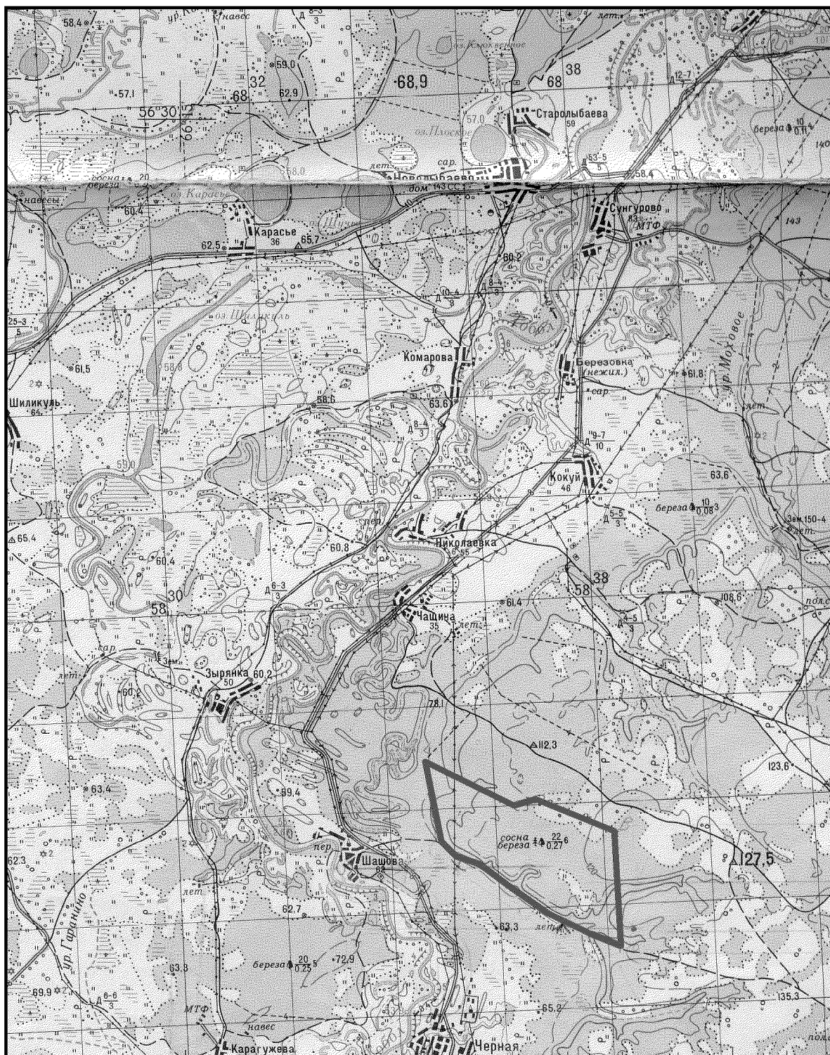
ОБЗОРНАЯ КАРТА ПАМЯТНИКА ПРИРОДЫ РЕГИОНАЛЬНОГО ЗНАЧЕНИЯ «ШАШОВСКИЙ (УЧАСТОК 1)» М 1:100 000