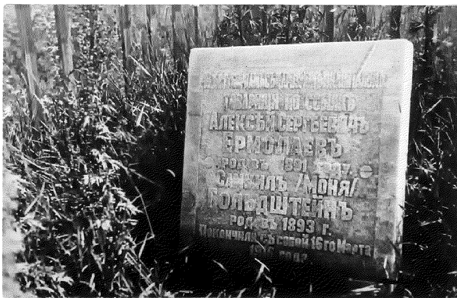
Видовая точка № 2.

Первоначальная мраморная могильная плита с надписью (1935 г.)