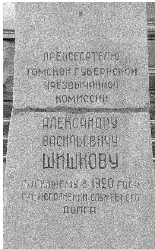
Видовая точка № 6. Информационная надпись на памятнике (2017 г.)