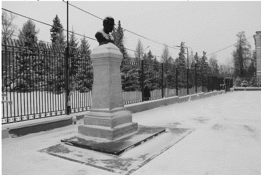
Видовая точка № 1. Общий вид памятника с северо-восточной стороны

дата съемки: 24.01.2023 г.