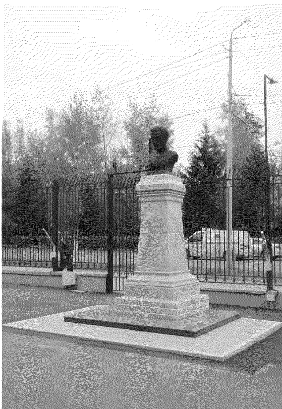
Видовая точка № 5. Памятник А.В. Шишкову, вид с северо-западной стороны