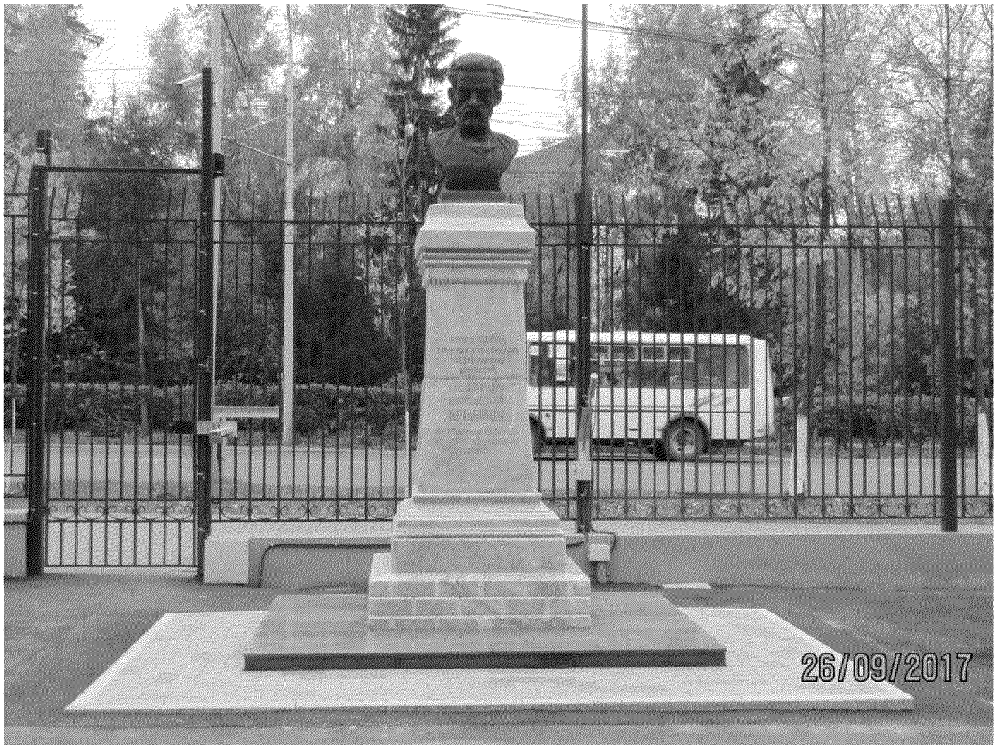
Видовая точка № 4. Памятник А.В. Шишкову, вид с северной стороны