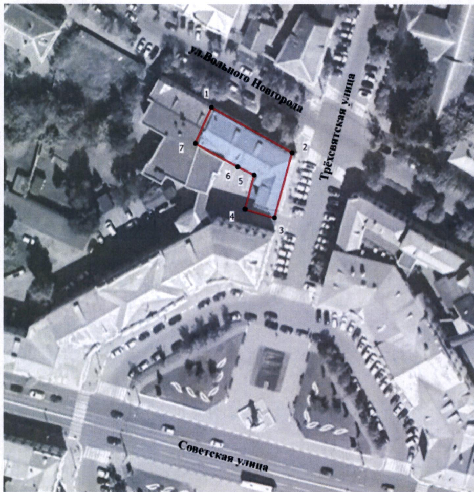
Схема границ территории объекта культурного наследия регионального значения «Дом жилой, кон. XVIII – нач. XIX вв., 2-ая четв. XIX в.», расположенного по адресу: Тверская область, город Тверь, улица Вольного Новгорода, дом 10