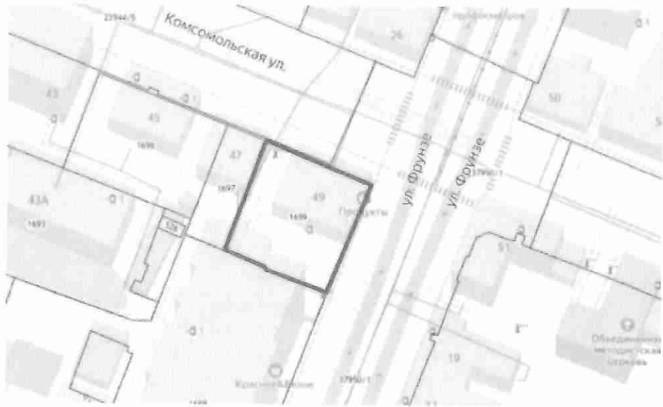
Границы территории объекта культурного наследия