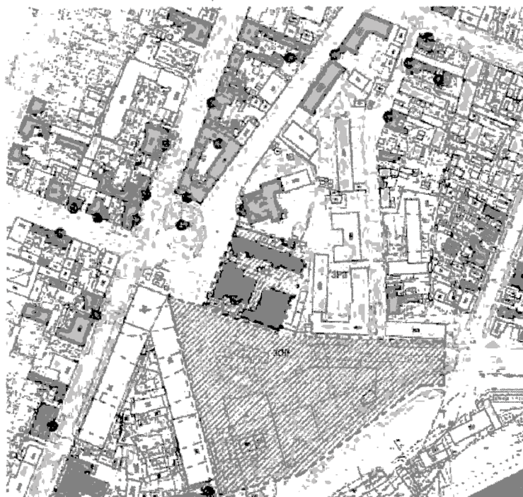
Границы территории ОКН

Приказ Управления государственной охраны объектов культурного наследия Самарской области от 25.05.2017 № 54 «Об утверждении границ территорий и зон охраны объектов культурного наследия регионального значения, расположенных на территории Самарской области, режимов использования земель и градостроительных регламентов в границах данных зон»