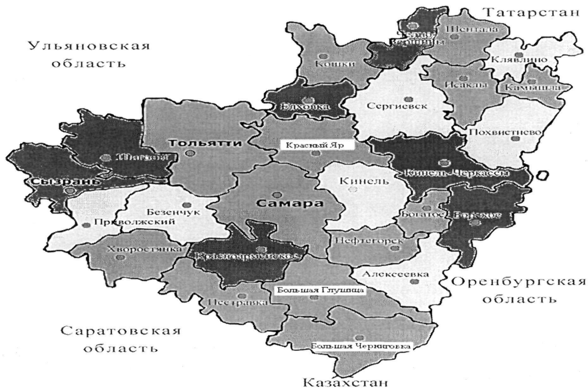
Рис. 2. Уровень смертности женщин трудоспособного возраста в Самарской области

100 тыс. населения. Наиболее высокие уровни смертности мужчин были зарегистрированы в муниципальных районах области: Кинель-Черкасский (1046,09 на 100 тыс. населения), Безенчукский (1002,71 на 100 тыс. населения), Алексеевский (975,47 на 100 тыс. населения), Шигонский (975,21 на 100 тыс. населения), Большечерниговский (966,48 на 100 тыс. населения), Борский (919,51 на 100 тыс. населения), Сызранский (907,41 на 100 тыс. населения), Челно-Вершинский (892,86 на 100 тыс. населения), Шенталинский (886,36 на 100 тыс. населения), в городских округах Чапаевск (947,94 на 100 тыс. населения) и Октябрьск (922,0 на 100 тыс. населения). Самые низкие уровни смертности мужчин отмечались в муниципальных районах Волжский (426,45 на 100 тыс. населения), Нефтегорский (537,52 на 100 тыс. населения), в городских округах Тольятти (558,68 на 100 тыс. населения) и Самара (567,14 на 100 тыс. населения).