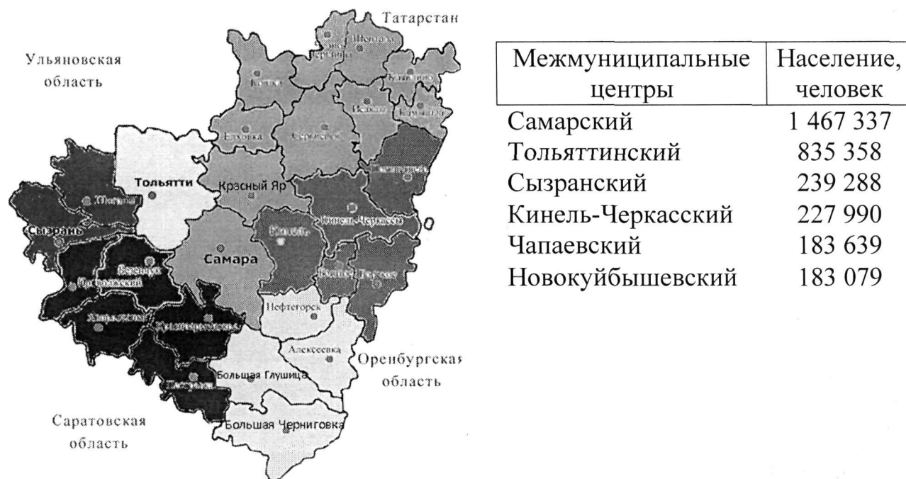
Рис. 5. Зоны обслуживания межмуниципальных первичных центров общественного здоровья

С целью разработки и реализации муниципальных программ укрепления здоровья, корпоративных программ укрепления здоровья на рабочих местах, направленных на формирование здорового образа жизни и профилактику неинфекционных заболеваний, поэтапно на базе территориальных отделов Центра организуются межмуниципальные первичные центры общественного здоровья (рис 5).