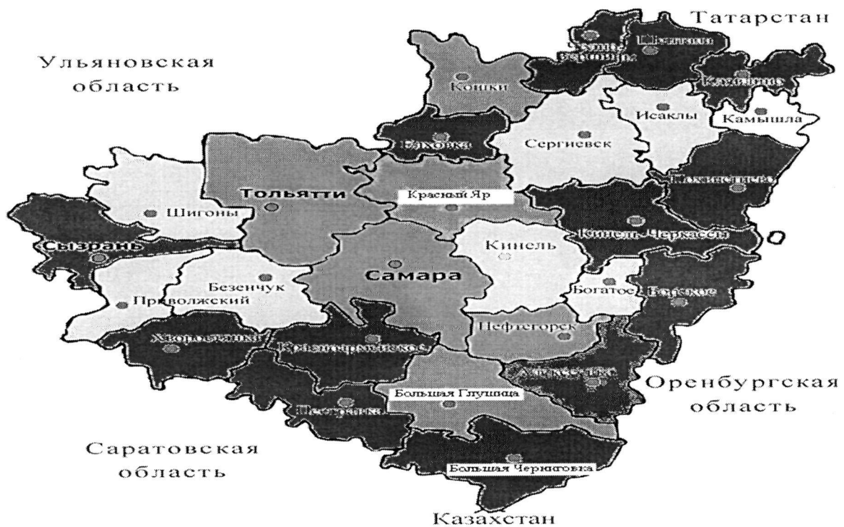
Рис. 3. Уровень смертности населения трудоспособного возраста в Самарской области от травм и отравлений

Наиболее высокие уровни смертности женщин были зарегистрированы в муниципальных районах области: Шигонский (410,33 на 100 тыс. населения), Красноармейский (349,91 на 100 тыс. населения), Сызранский (339,53 на 100 тыс. населения), Борский (303,57 на 100 тыс. населения), Кинель-Черкасский (283,45 на 100 тыс. населения), Челно-Вершинский (277,69 на 100 тыс. населения), городских округа: Чапаевск (333,26 на 100 тыс. населения) и Жигулевск (325,73 на 100 тыс. населения). Самые низкие уровни смертности женщин отмечались в муниципальных районах Богатовский (98,46 на 100 тыс. населения), Хворостянский (122,34 на 100 тыс. населения), Большеглушицкий (133,42 на 100 тыс. населения), в городских округах Тольятти (181,80 на 100 тыс. населения) и Самара (189,55 на 100 тыс. населения).