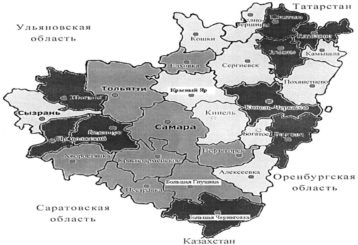
Рис. 4. Уровень показателя смертности мужчин трудоспособного возраста в Самарской области от болезней системы кровообращения

Значения показателей смертности мужчин и женщин трудоспособного возраста от внешних причин смерти (травмы и отравления) по отдельным территориям области значительно отличаются от 80,41 до 306,9 на 100 тыс. населения при среднеобластном показателе 163,5 на 100 тыс. населения. Наиболее высокие уровни смертности от травм и отравлений отмечались у жителей сельских районов области.