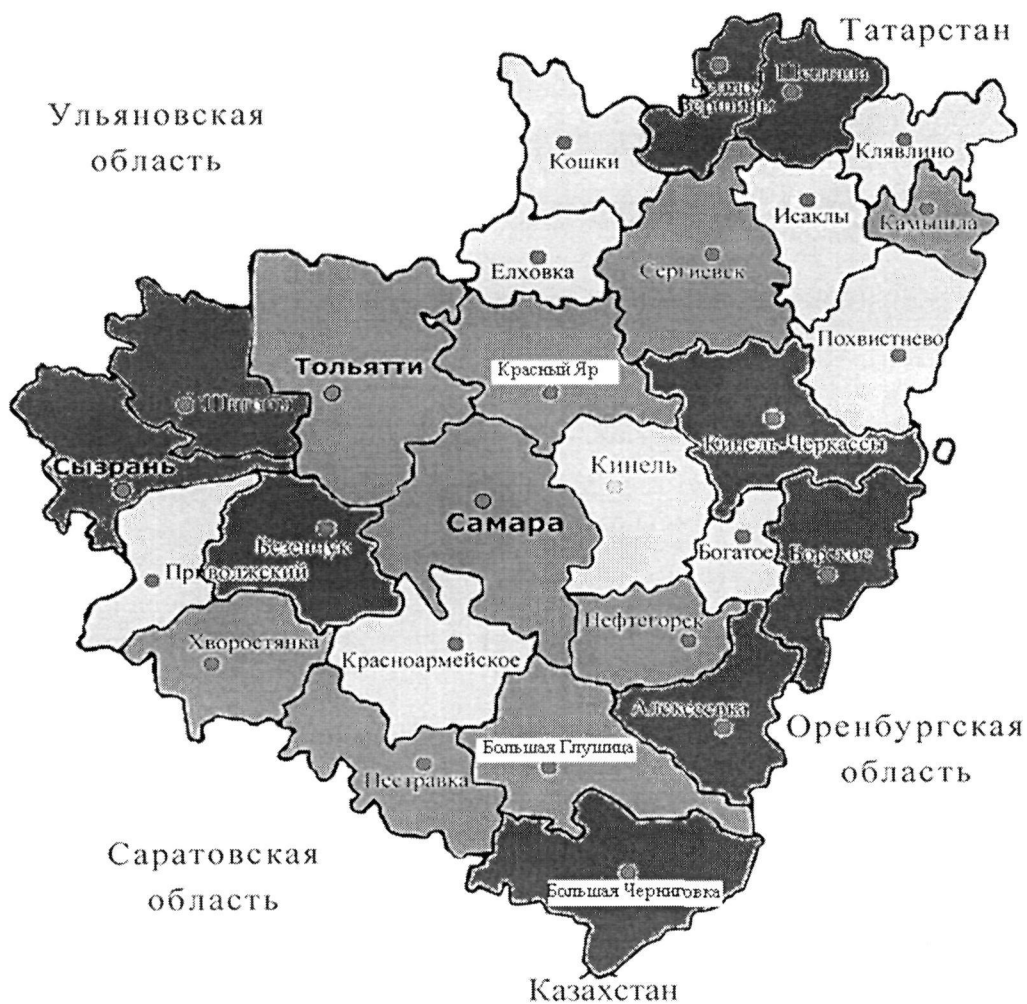
Рис. 1. Уровень смертности мужчин трудоспособного возраста в Самарской области

Показатели уровня смертности мужчин и женщин трудоспособного возраста в разрезе городов и районов Самарской области представлены на рисунках 1 – 4.