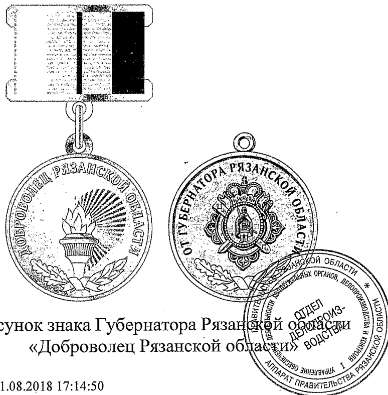
Рисунок знака Губернатора Рязанской области «Доброволец Рязанской области»

Знак при помощи ушка и кольца соединяется с золотистой металлической колодкой, представляющей собой прямоугольную пластинку высотой 17 мм и шириной 27 мм с фигурными рамками в верхней и нижней частях. Вдоль основания колодки идут прорезы, сквозь которые продета лента Знака, обтягивающая основную часть колодки (пластину). Лента Знака состоит из белой, желтой и красной полос в соотношении 1:2:1 с красной продольной полоской посередине желтой полосы. Ширина ленты – 24 мм, ширина средней полоски – 2 мм.