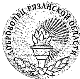
Рисунок лацканной миниатюры знака Губернатора Рязанской области «Доброволец Рязанской области»

На оборотной стороне – крепление цанга-бабочка.