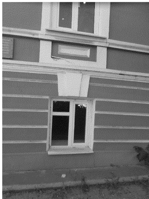
прямоугольные оконные проемы с веерными замками в уровне первого этажа главного фасада