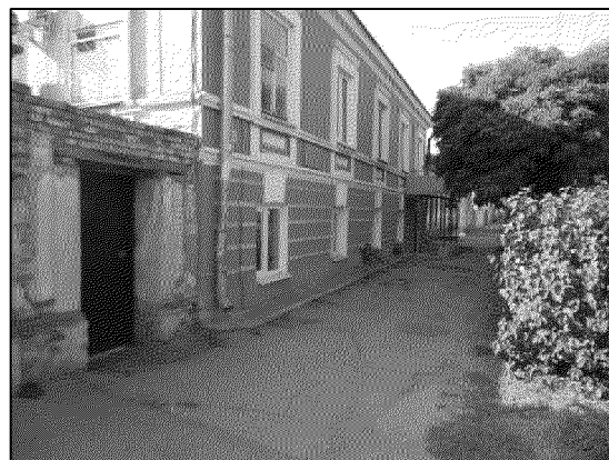
фрагмент главного северо-восточного фасада объекта

прямоугольные стилизованные филенки и ниши в подоконном пространстве второго этажа; междуэтажный профилированный пояс на замках; ритм прямоугольных оконных проемов с всерными замками в уровне первого этажа; ленточный руст фасадной стены в уровне первого этажа; кордон цоколя; ажурный металлический козырек на металлических кронштейнах над дверным проемом юго-восточного дворового фасада с датой строительства «1876» в тимпане козырька. Габариты и конфигурация всех выше перечисленных элементов