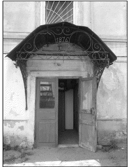
ажурный металлический кованый козырек на металлических кронштейнах над дверным проемом юго-восточного дворового фасада с датой строительства «1876» в тимпане козырька

5. Материал и характер обработки главного северо-восточного и юго-восточного дворового фасадов объекта культурного наследия, включая декор, формирующий пластику фасадов