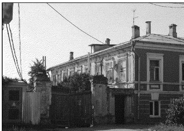
юго-восточный дворовый фасад