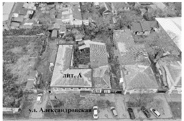
местоположение объекта культурного наследия

2. Объемно-пространственная композиция объекта культурного наследия лит. А Г-образной конфигурации в плане, кирпичного, двухэтажного, с первым (цокольным) этажом, подвалом и многоскатной крышей