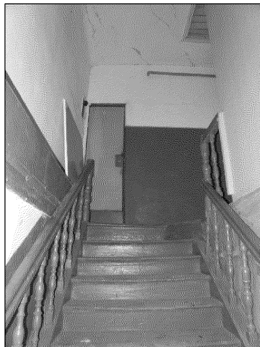
внутренняя междуэтажная деревянная лестница

7. Внутренняя междуэтажная деревянная лестница в объеме лестничной клетки, включая деревянное ограждение из балясника, ее местоположение в юго-восточной части объекта культурного наследия, габариты, конфигурация, материал изготовления и рисунок балясин ограждения