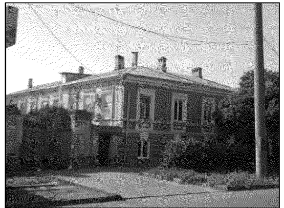
вид объекта с востока

5. Материал и характер обработки главного северо-восточного и юго-восточного дворового фасадов объекта культурного наследия, включая декор, формирующий пластику фасадов