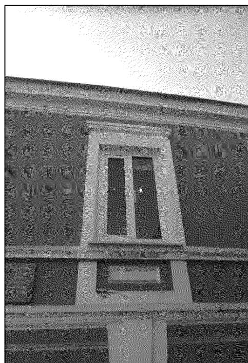
прямоугольные оконные проемы второго этажа главного фасада с плоскими наличниками и карнизными сандриками