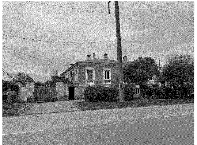
местоположение объекта культурного наследия в застройке ул. Александровской

2. Объемно-пространственная композиция объекта культурного наследия лит. А Г-образной конфигурации в плане, кирпичного, двухэтажного, с первым (цокольным) этажом, подвалом и многоскатной крышей