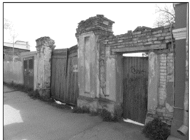
въезд и вход во двор

6. Местоположение и оформление въезда во двор со стороны ул. Александровской, выполненного из кирпичных столбов с профилированным карнизом и прямоугольными нишами, и входа, выполненного в виде оштукатуренного кирпичного портала с криволинейным завершением и столбами, декорированными плоскими пилястрами тосканского ордера