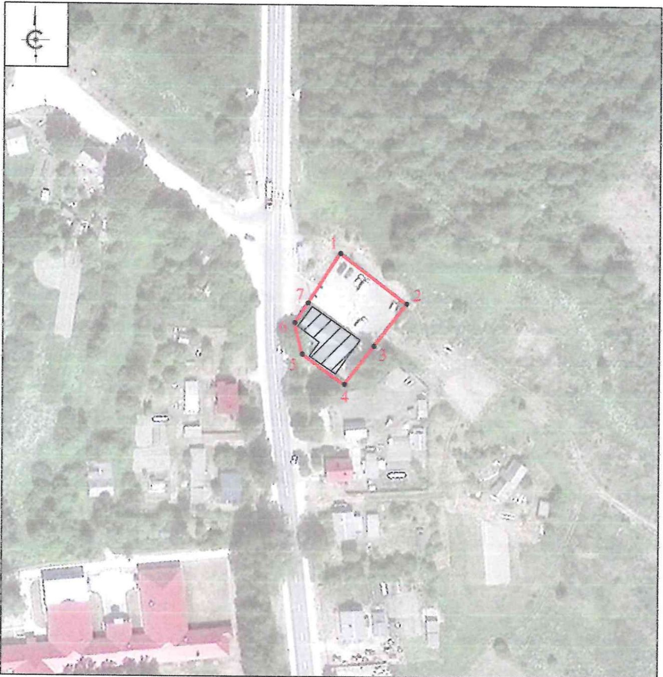
Схема границ территории объекта культурного наследия регионального значения «Усадьба крестьянская. Дом жилой со службами», начало XX в., расположенного по адресу: Псковская область, Гдовский муниципальный округ, д. Бешкино-1, улица Центральная, дом № 7