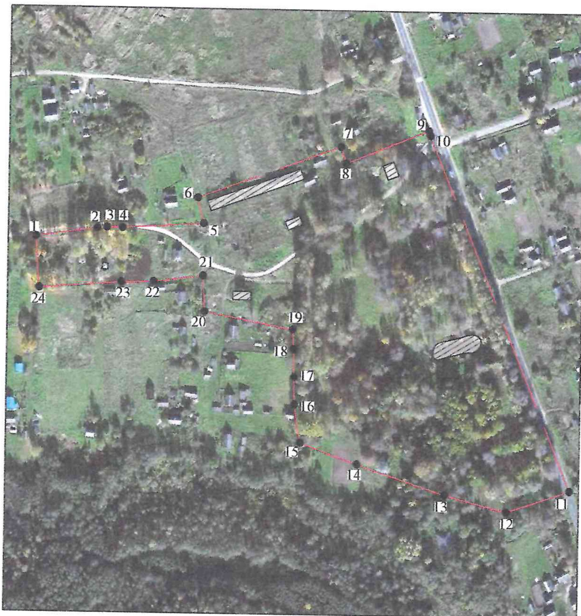
Схема границ территории объекта культурного наследия регионального значения «Среднепоместная усадьба», XIX в., расположенного по адресу: Псковская область, Новоржевский район, д. Стехново, Стехновская волость