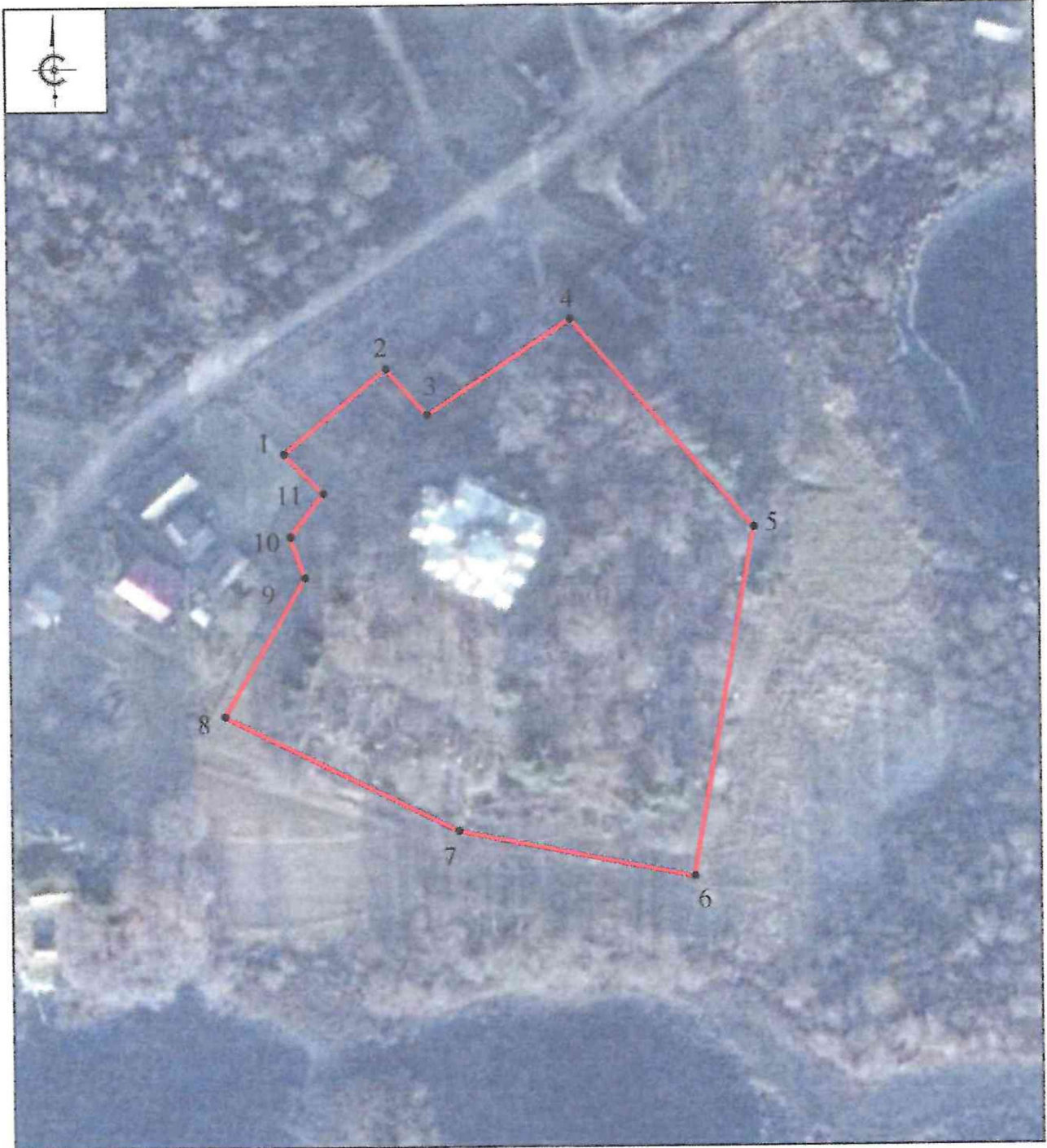
Схема границ территории объекта культурного наследия регионального значения «Церковь Покровская», 1774 г., расположенного по адресу: Псковская область, Новосокольнический район, сельское поселение «Маевская волость» д. Руново