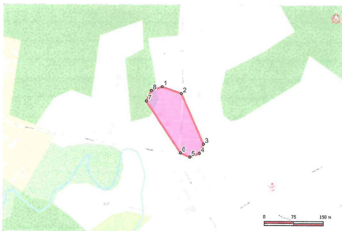
Схема границ территории объекта культурного наследия федерального значения «Курганная группа 3», II пол. I тыс. н.э., расположенного по адресу: Псковская область, Плюсский район, городское поселение «Плюсса», д. Куreja, в 0,4 км к северу от деревни