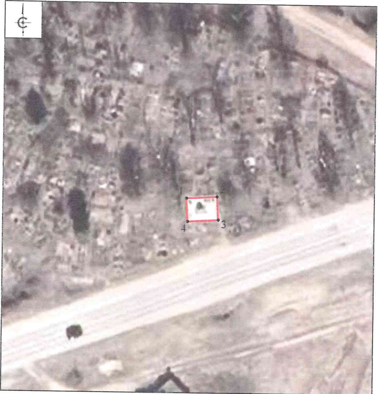
Схема границ территории объекта культурного наследия регионального значения «Братская могила Советских Воинов, погибших в 1944 г.», 1944 г., расположенного по адресу: Псковская область, Порховский район, сельское поселение «Полонская волость», д. Полоное