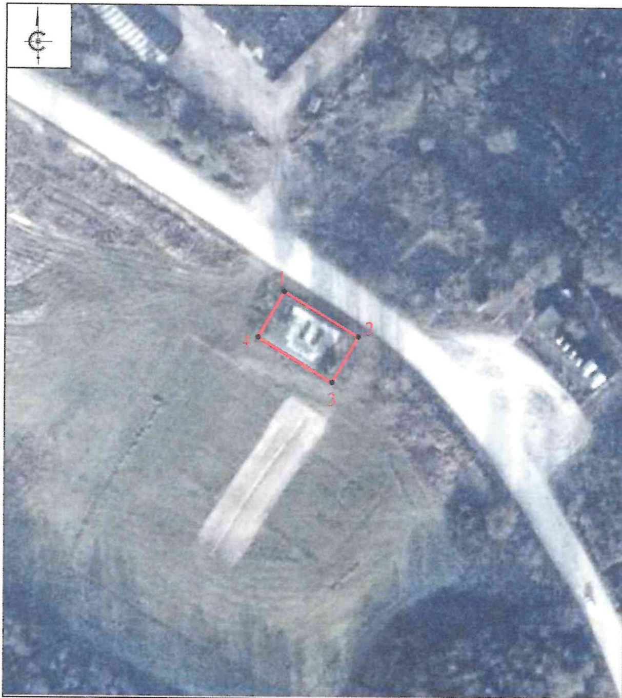
Схема границ территории объекта культурного наследия регионального значения «Братская могила воинов Советской Армии, погибших в 1944 г.», 1944 г., расположенного по адресу: Псковская область, Новосокольнический район, деревня Руново