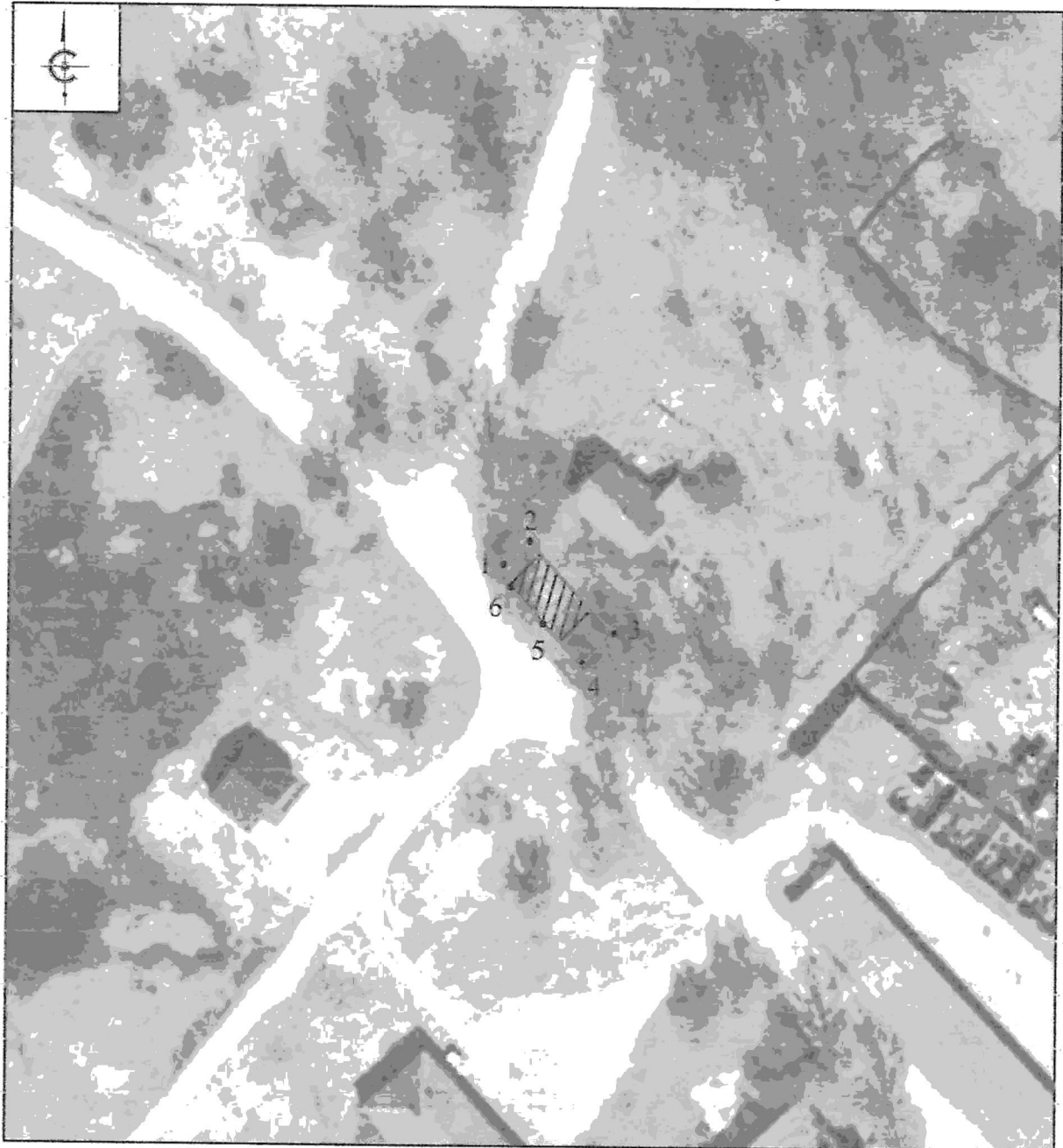
Схема границ территории объекта культурного наследия регионального значения «Братская могила воинов Советской Армии, погибших в 1944 г.», 1944 г., расположенного по адресу: Псковская область, Опочецкий район, сельское поселение «Пригородная волость», д. Макушино