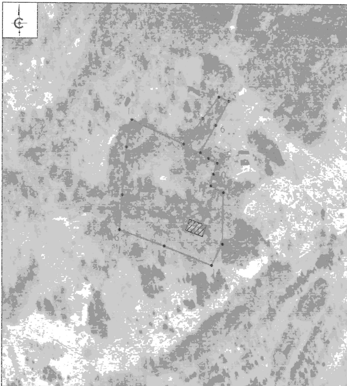
Схема границ территории объекта культурного наследия регионального значения «Дом Н.И. Кукольника», XIX в., расположенного по адресу: Псковская область, Опочецкий район, д. Соколово, Пригородная волость