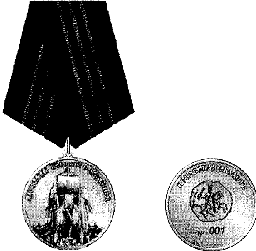
РИСУНОК медали Александра Невского