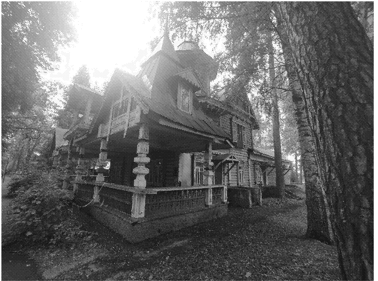
Фрагмент фасада объекта культурного наследия