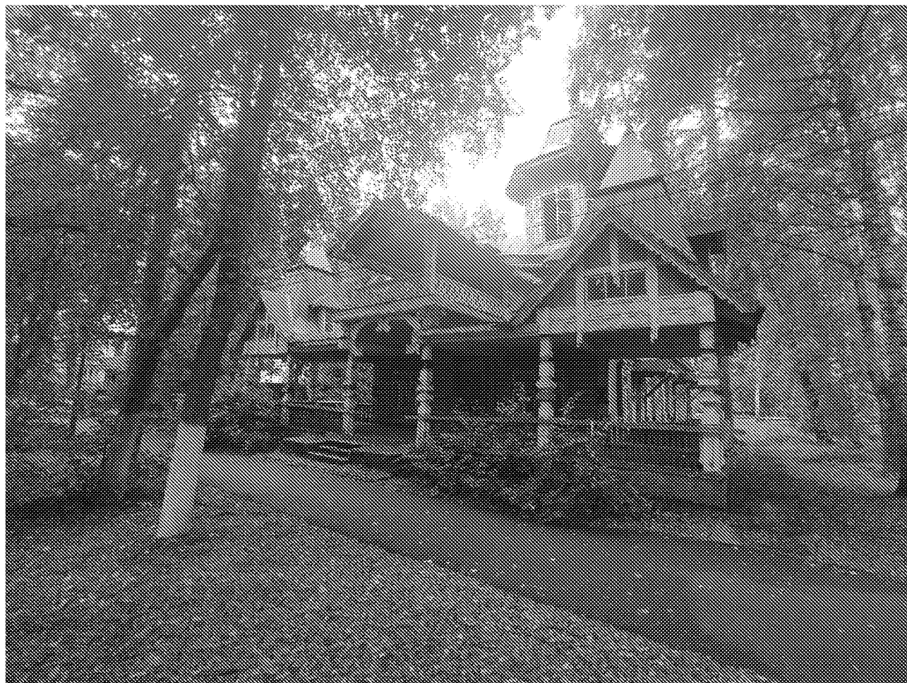
Вид на главный фасад объекта культурного наследия