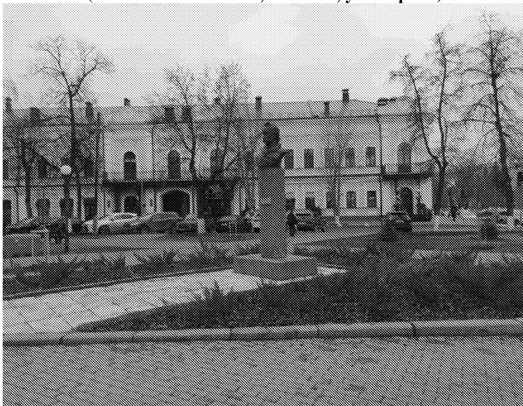
Общий вид на объект культурного наследия