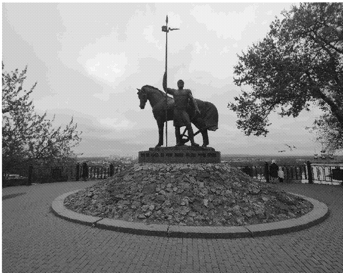
Общий вид на объект культурного наследия со стороны ул. Кирова