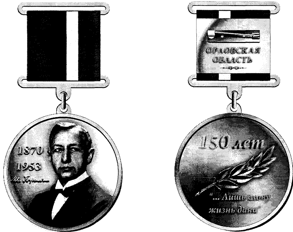
Рисунок памятной медали «150-летие И. А. Бунина»