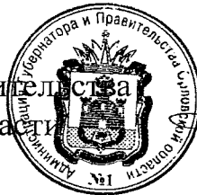
А. Е. Клычков

Председатель Правительства Орловской области