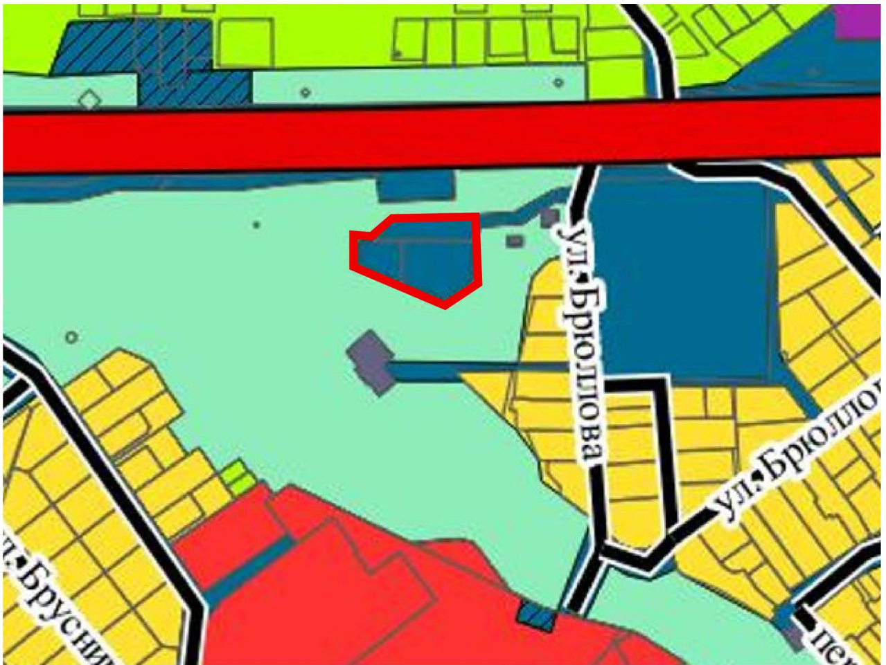
Схема границ территории для разработки документации по планировке территории (проект межевания территории в виде отдельного документа) в районе улицы Брюллова в городе Липецке

к приказу министерства строительства и архитектуры Липецкой области «О принятии решения о подготовке документации по планировке территории (проект межевания территории в виде отдельного документа) в районе улицы Брюллова в городе Липецке»