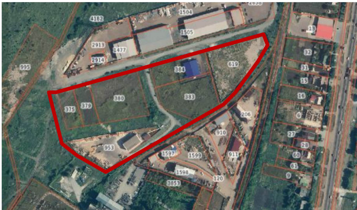
Схема границ территории для разработки документации по планировке территории (проект межевания территории в виде отдельного документа) в районе улицы Железнодорожная в селе Подгорное Липецкого муниципального округа, в части кадастрового квартала 48:13:1550501

к приказу министерства строительства и архитектуры Липецкой области «О принятии решения о подготовке документации по планировке территории (проект межевания территории в виде отдельного документа) в районе улицы Железнодорожная в селе Подгорное Липецкого муниципального округа, в части кадастрового квартала 48:13:1550501»