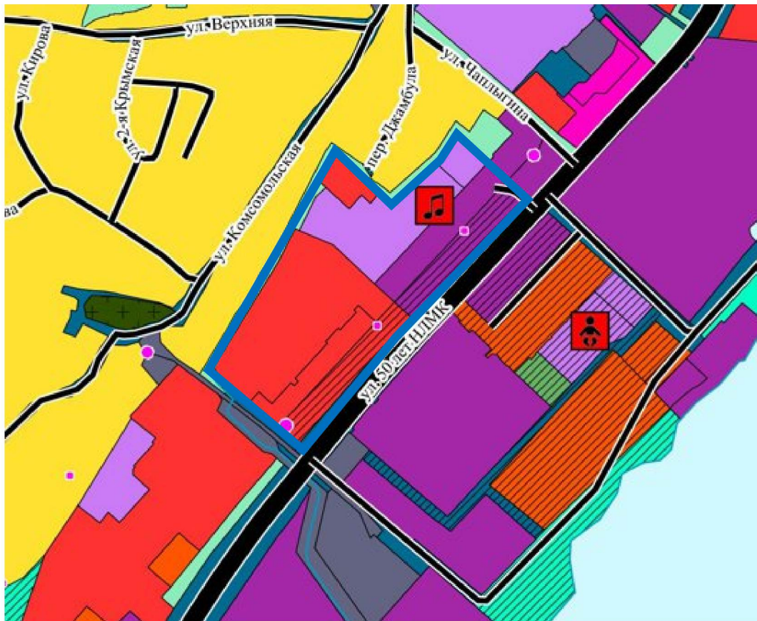
Схема границ территории для разработки документации по планировке территории (проект планировки территории, проект межевания территории в составе проекта планировки территории) в районе улиц 50 лет НЛМК и Лутова в городе Липецке

к приказу министерства строительства и архитектуры Липецкой области «О принятии решения о подготовке документации по планировке территории (проект планировки территории, проект межевания территории в составе проекта планировки территории) в районе улиц 50 лет НЛМК и Лутова в городе Липецке»