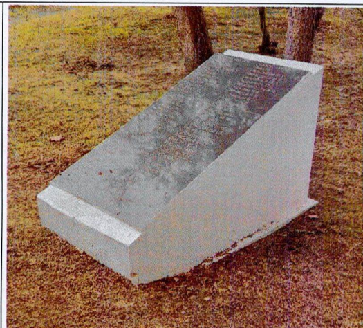
Каменная мемориальная плита на бетонной тумбе

4.3. Мемориальные плиты с фамилиями погребенных воинов: диабаз полированный. Основание: бетон окрашенный.