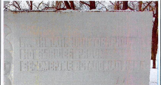
Текст на нижнем блоке памятной стены