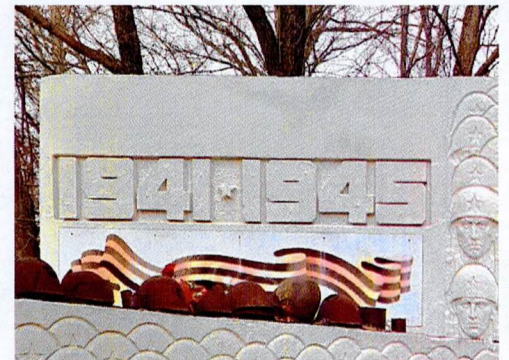
Текст на верхнем блоке памятной стены