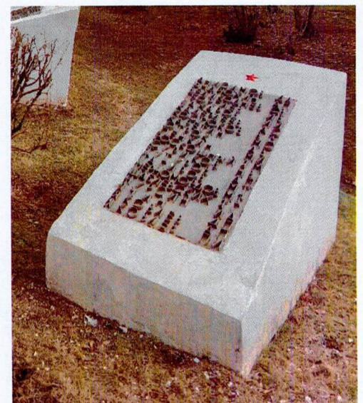
Металлическая мемориальная плита на бетонной тумбе