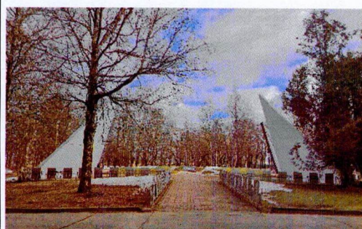
Общий вид на стелы с запада

4.4. Пять стел, символизирующие склоненные знамена (расположение, габариты, конфигурация, тип отделки-окраска)