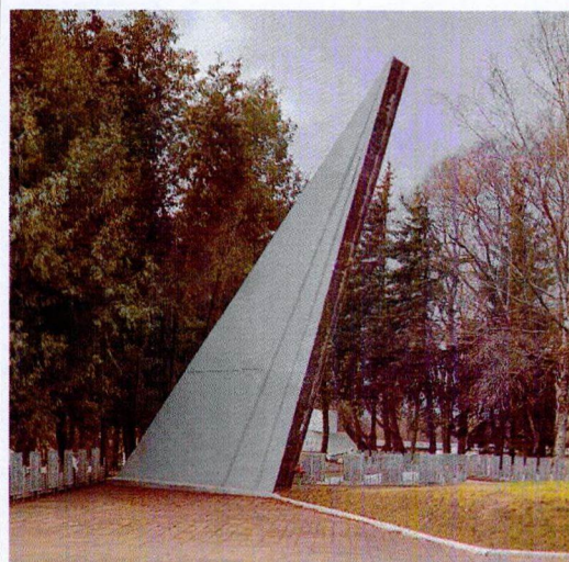
Вид на юго-западную стелу