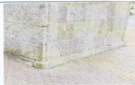
Облицовка постамента известняком

«В БОЯХ ЗА КИРИШИ ПРИНИМАЛИ УЧАСТИЕ / ВОИНЫ СОЕДИНЕНИЙ И ЧАСТЕЙ / 4 -Й И 54-Й Армии Волховского ФРОНТА»