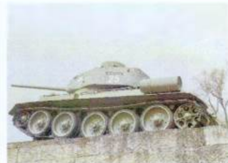
Общий вид на танк с юго-запада