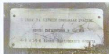
Памятная доска на тумбе справа от постамента (фотография 1991 г.)

Предмет охраны может быть уточнен при проведении дополнительных научных исследований.