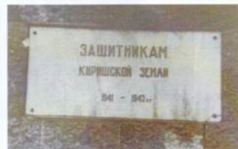
Памятная доска на лицевой стороне постамента (фотография 1991 г.)