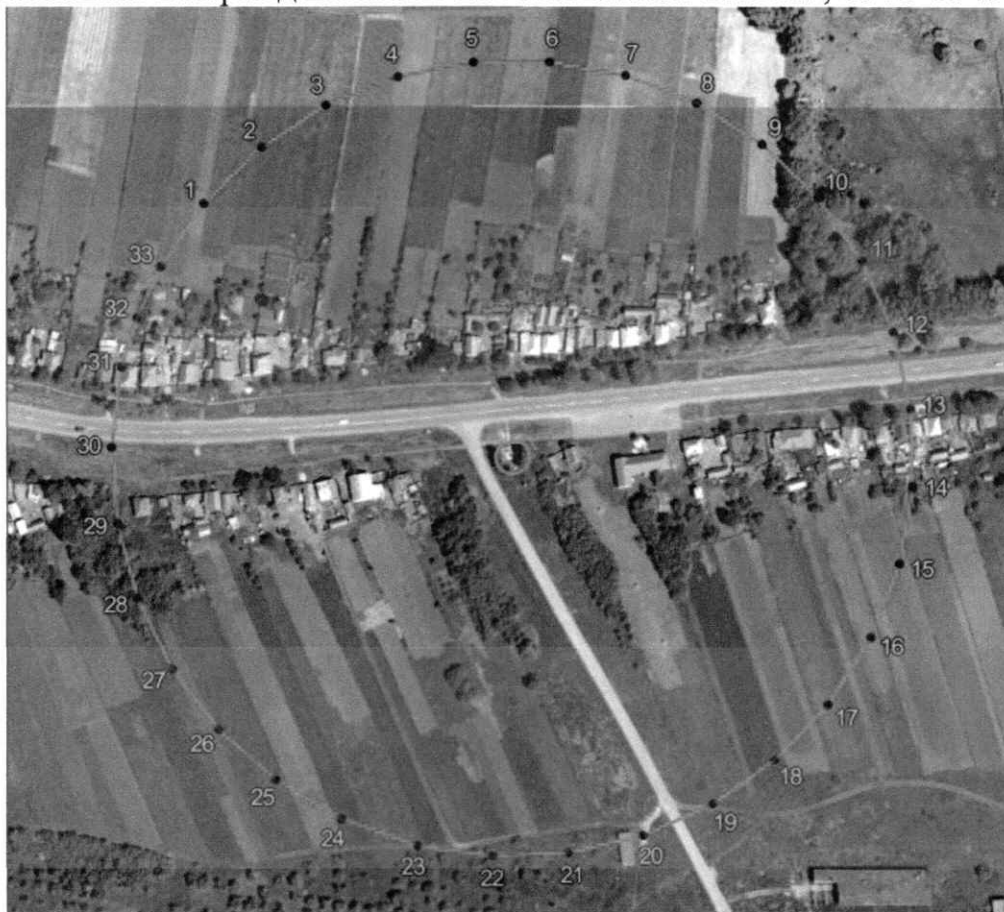
Масштаб 1: 3000

1. Графическое описание границ защитной зоны объекта культурного наследия регионального значения «Братская могила воинов Советской Армии, погибших в период Великой Отечественной войны», 1941-1945 гг.