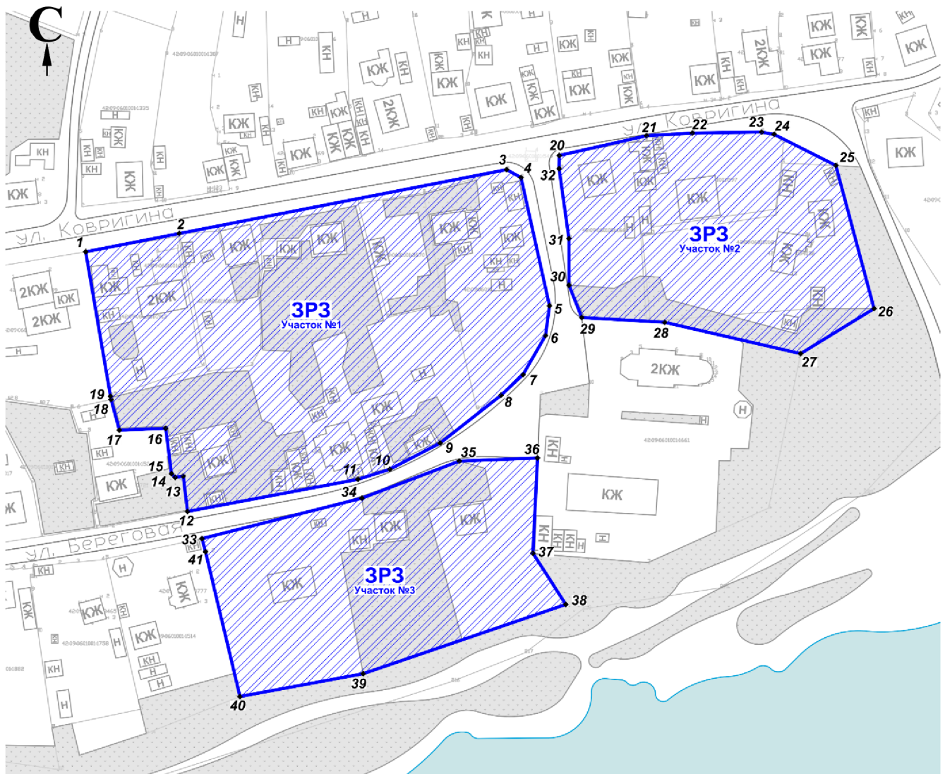
Схема границ ЗРЗ объекта культурного наследия регионального значения «Каменная церковь, построенная до 1768 года, под куполами с хорошо сохранившимся силуэтом и основными объемами, ныне склад для комбикорма»