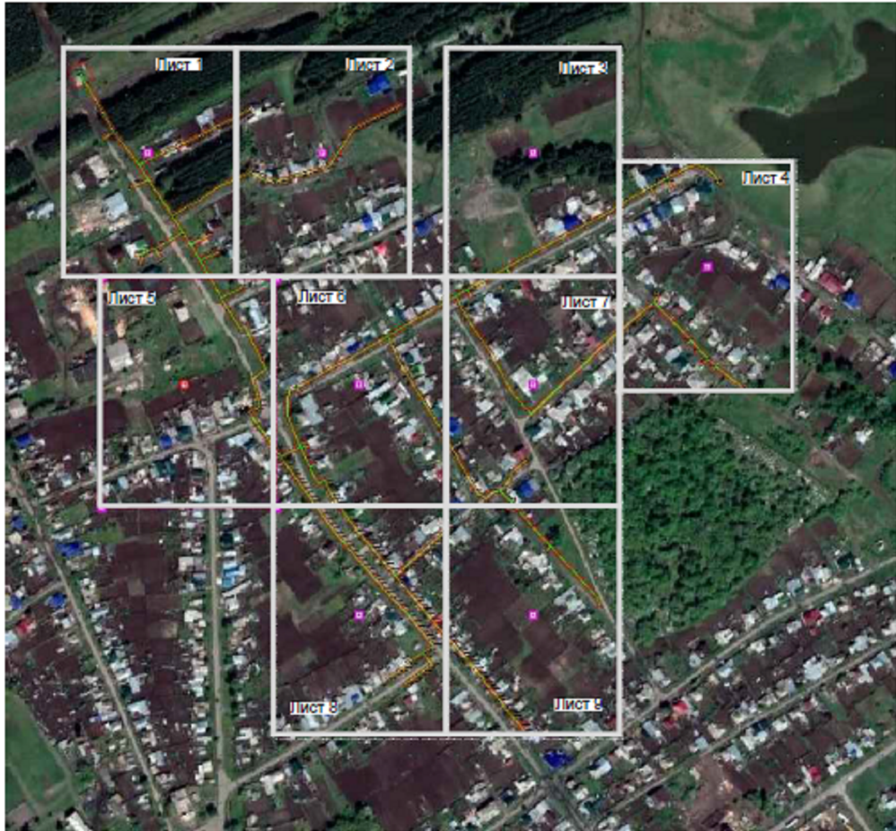
Обзорная схема расположения листов

Используемые условные знаки и обозначения