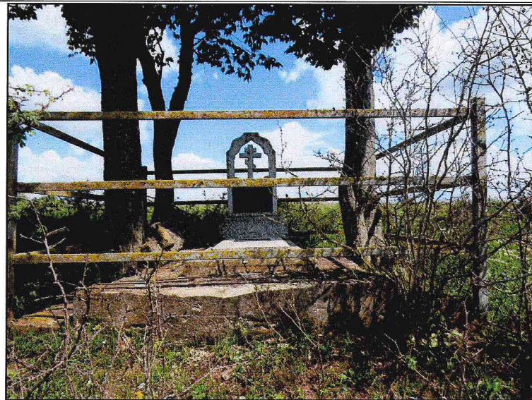
Вид с юга.

Территория воинского мемориала квадратная в плане, в центре которой установлен памятник с надгробием. Слева и справа от Памятника высажены деревья.