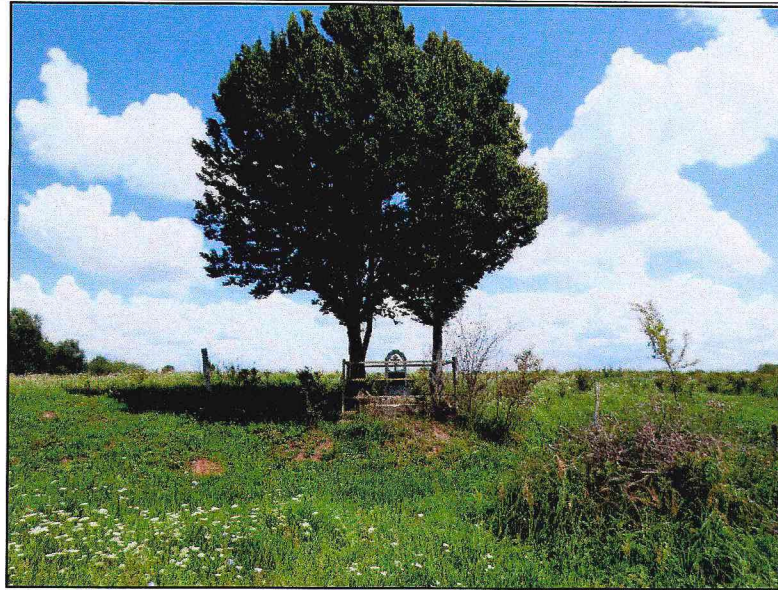
Вид на памятник от дороги.

3. Объемно-пространственное построение территории.