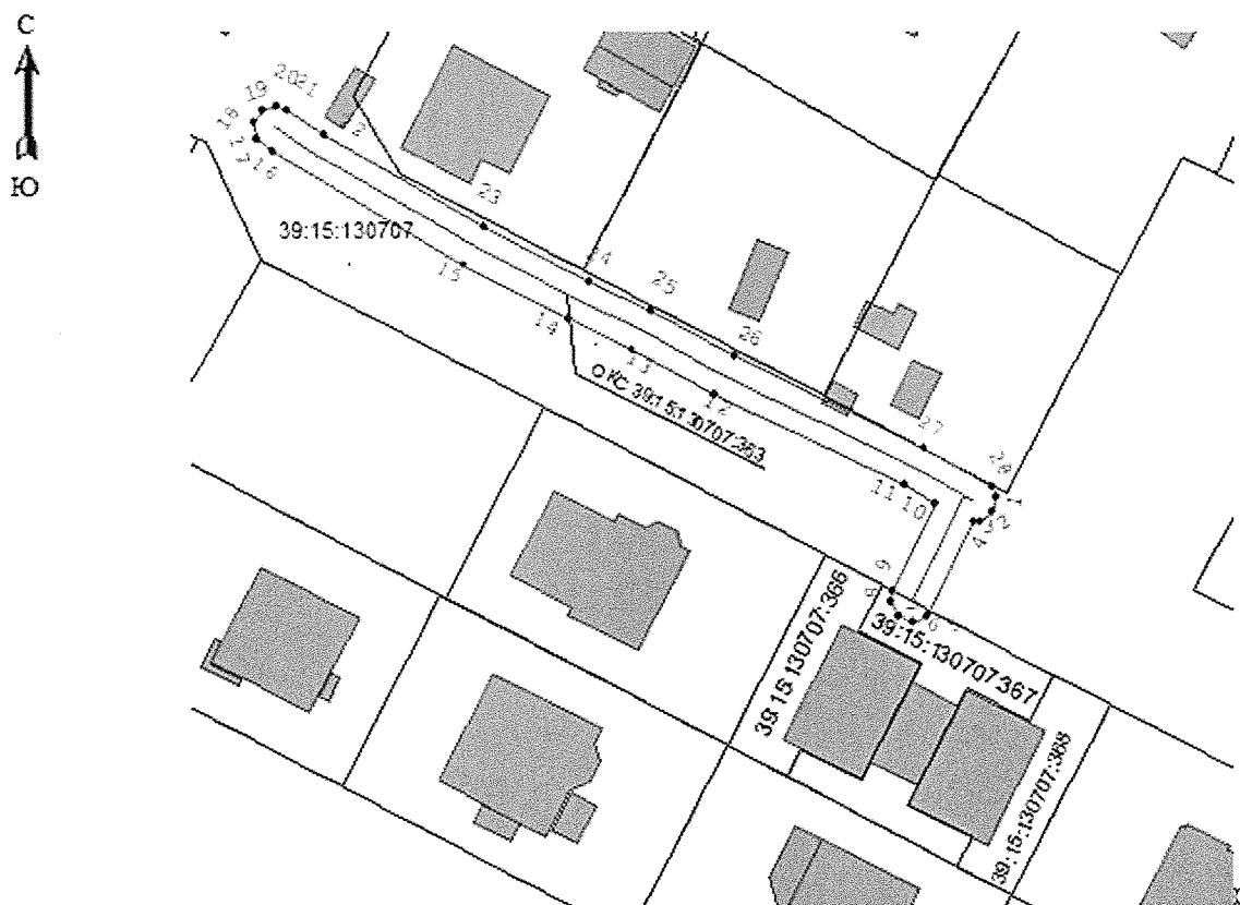
Условные обозначения: ¶

Графическое описание местоположения границ охранной зоны газораспределительной сети: «Участок газопровода низкого давления до границ земельного участка с КН 39:15:130707:28 по ул. Владимирской, 17 в г. Калининграде для газоснабжения объекта капитального строительства» расположенный по адресу: Калининградская область, г. Калининград, ул. Владимирская, кадастровый (или условный) номер 39:15:130707:363.