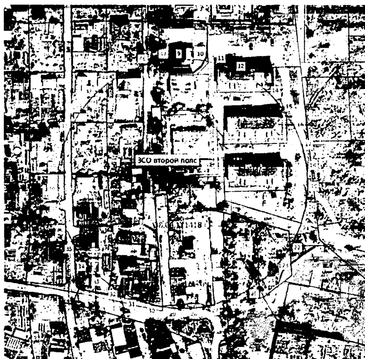
план границ объекта

Второй пояс зоны санитарной охраны одиначного водозабора подземных вод (скважина 778) для питьевого и хозяйственно-бытового водоснабжения п. Малая Топка, Иркутского района, Иркутской области, расположенного по адресу: ул. Ключевая (кадастровый номер земельного участка 38:06:111418:13488), устанавливающей границы зоны санитарной охраны подземного источника и ограничения использования земельных участков в границах зон