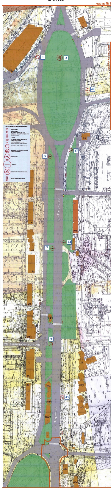
СХЕМА РАЗМЕЩЕНИЯ РЕКЛАМНЫХ КОНСТРУКЦИЙ НА ТЕРРИТОРИИ ГОРОДСКОГО ОКРУГА ГОРОД ВОРОНЕЖ ДЛЯ УЧАСТКА ТЕРРИТОРИИ: проспект Патриотов М 1:1000