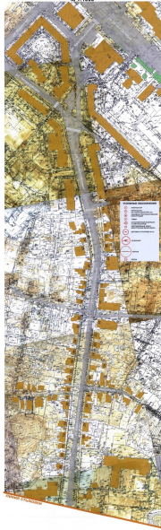
СХЕМА РАЗМЕЩЕНИЯ РЕКЛАМНЫХ КОНСТРУКЦИЙ НА ТЕРРИТОРИИ ГОРОДСКОГО ОКРУГА ГОРЬКОГО ДЛЯ УЧАСТКА ТЕРРИТОРИИ: улица Космодемьянская М 1:1000