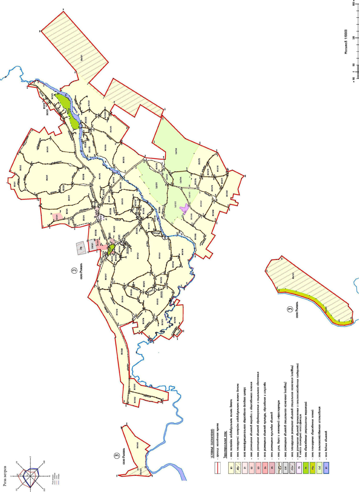
Фрагмент 3.1 карты градостроительного зонирования Хреновского сельского поселения Новоусманского муниципального района Воронежской области Карта границ территориальных зон населённого пункта - село Рыканы