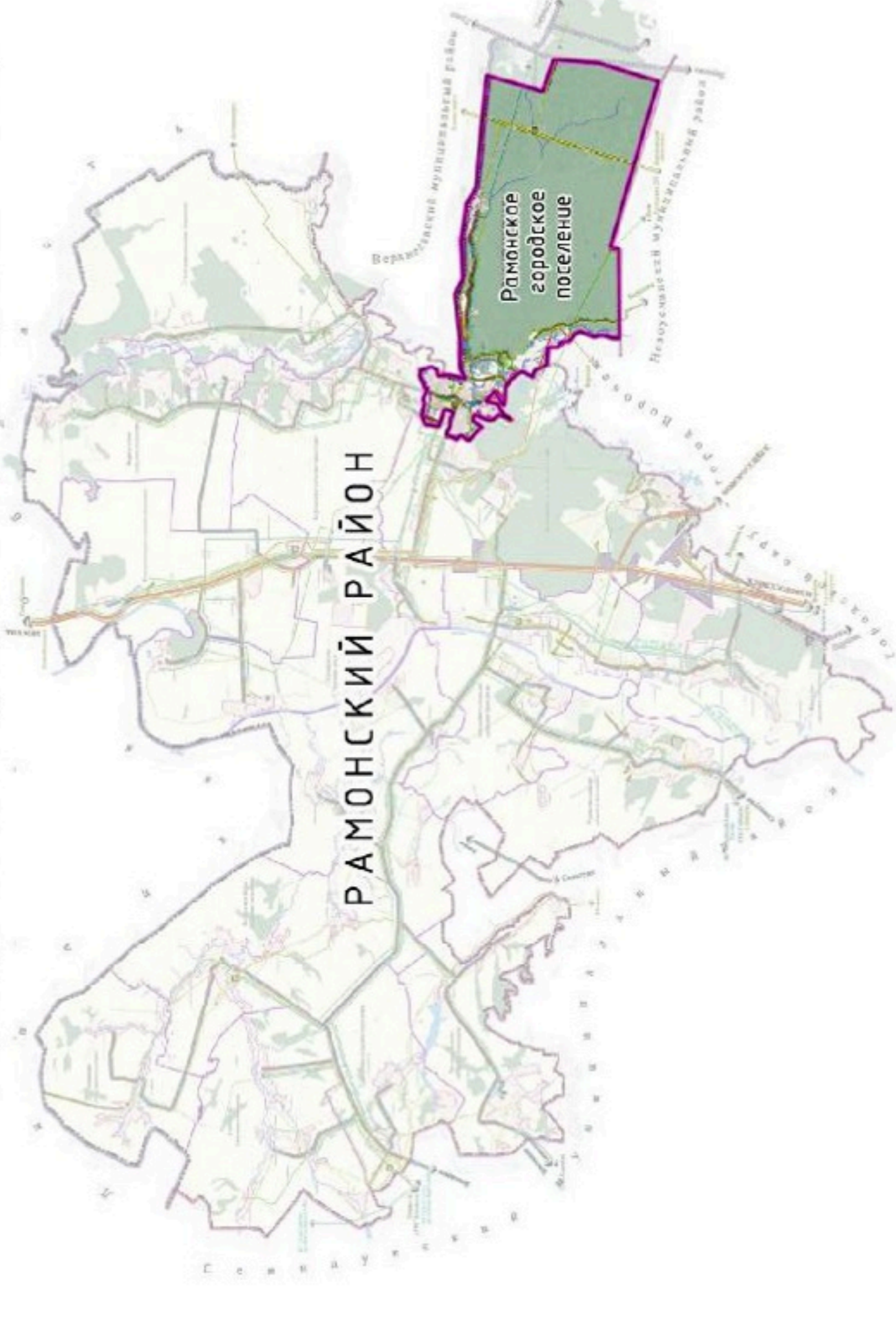
Схема размещения объектов культурного наследия с обозначением прилегающих территорий

Ситуационная схема расположения Рамонского городского поселения в границах Рамонского муниципального района Воронежской области