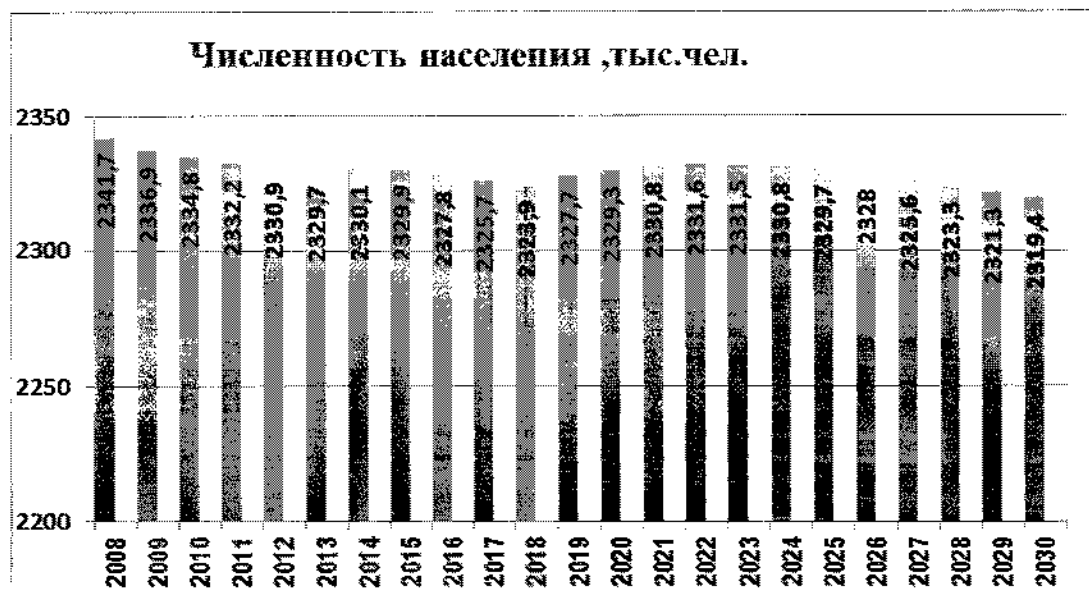
Рисунок 1 - Динамика численности населения Воронежской области

Общая численность населения Воронежской области в 2019 году составляет 2,3 млн человек, в т.ч. городское население - 67,5 % (1,57 млн человек).