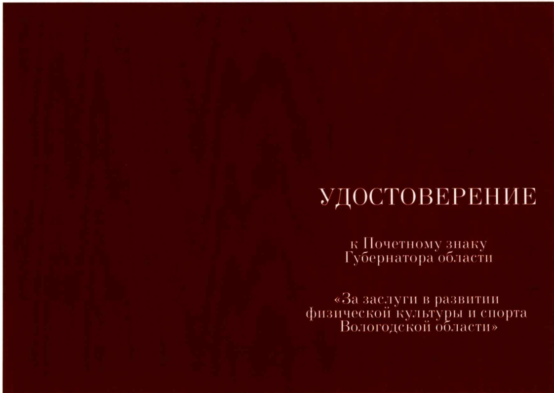
РИСУНОК удостоверения к Почетному знаку Губернатора области «За заслуги в развитии физической культуры и спорта Вологодской области»