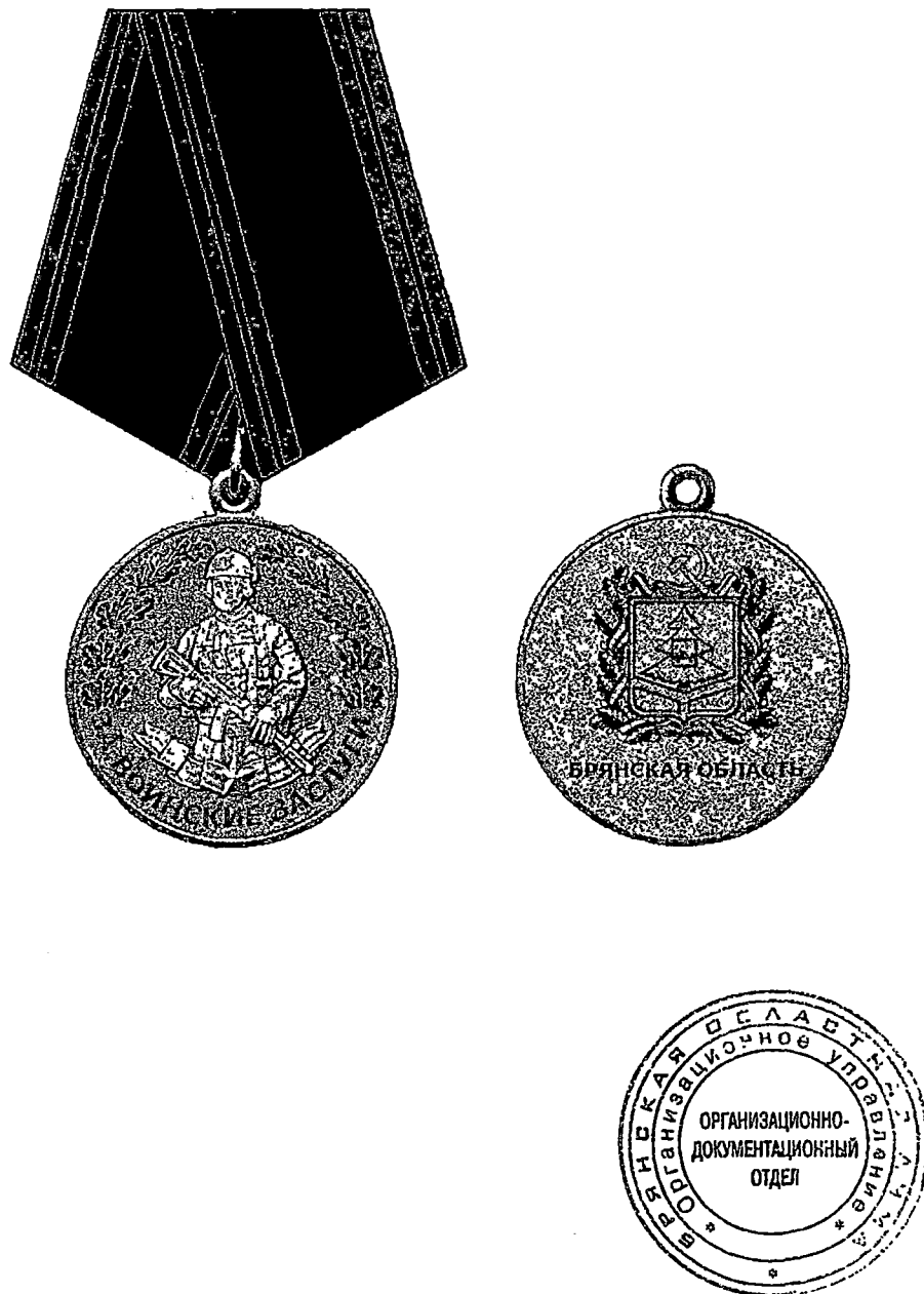
Рисунок памятной медали «За воинские заслуги перед Брянской областью»

Приложение 3 к постановлению Брянской областной Думы от 27.03.2026 № 8-567