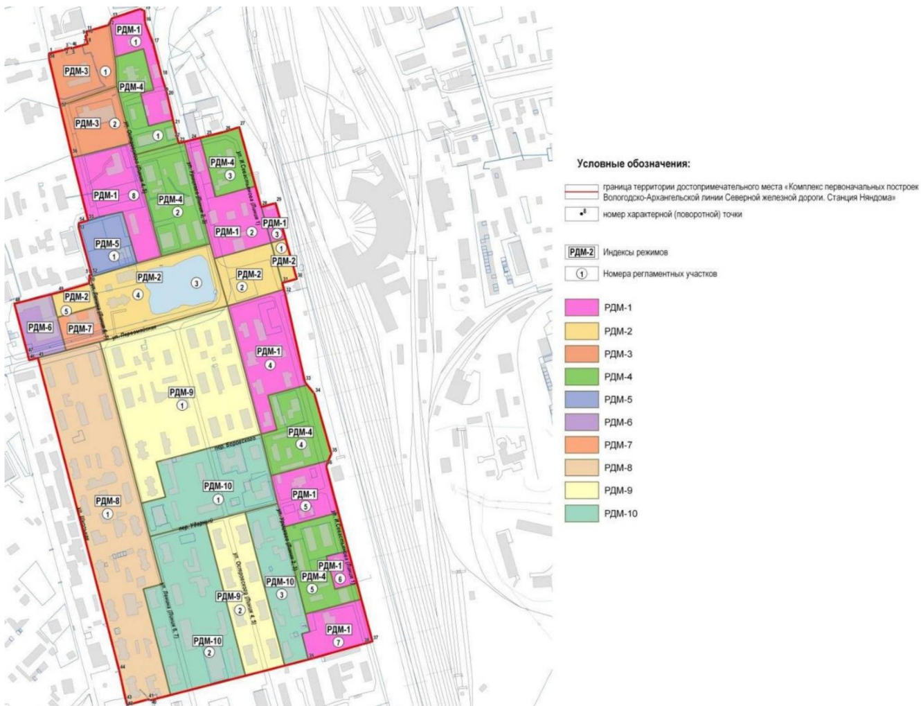
Рисунок 1 Схема территории достопримечательного места «Комплекс первоначальных построек Вологодско-Архангельской линии Северной железной дороги. Станция Нядома»

4. Установление требований к осуществлению деятельности и градостроительным регламентам в границах территории достопримечательного места осуществляется в соответствии с зонированием территории по характеру и историко-культурному потенциалу земель.